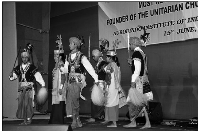
Unitárius fiatalok ősi khászi táncot járnak

Megtanultuk azt is, ahogy az erős hit a sokkal nehezebb körülmények között is optimizmust sugall a