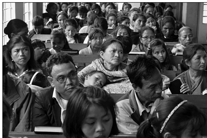
Ünnepi istentisztelet a nongkremit gyülekezetben