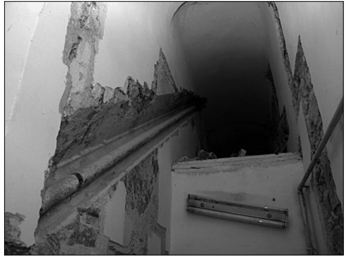
Falba mélyített, faragott kőfogódzó

A Biasini család 1883-ban adta el a házat az Unitárius Egyháznak. Az egyház csupán kisebb javítási és felújítási munkálatokat végzett, többek között cserép-