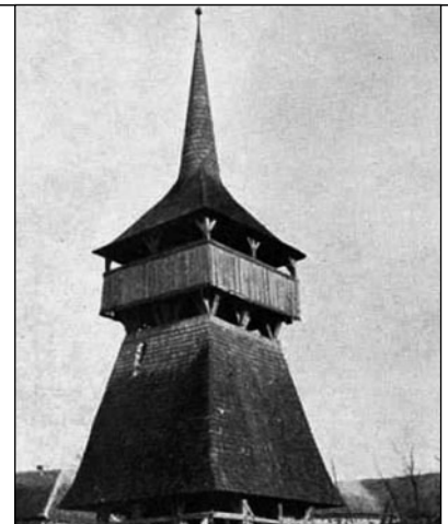
A magyarsárosi harangláb. A sárosi zsinaton szentelték püspökké rejtvényünk főhősét.

Kézzel-lábbal magyaráz Budapest része Zloty, röviden Bibliai hajós Itt is járt egyetemre a püspök