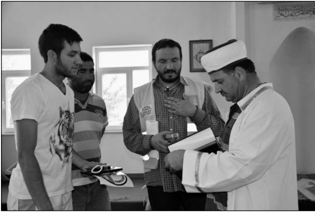
Vallásközi párbeszéd: a törökországi Chakmakban a helyi imám Koránt ajándékoz a kolozsvári keresztény fiataloknak

párbeszéd nélkül. Jelentős különbségek választják el ma mind hittanilag, mind kulturálisan a monoteista világvallásokat. A dialógus nem ezek elfedésére, elta-