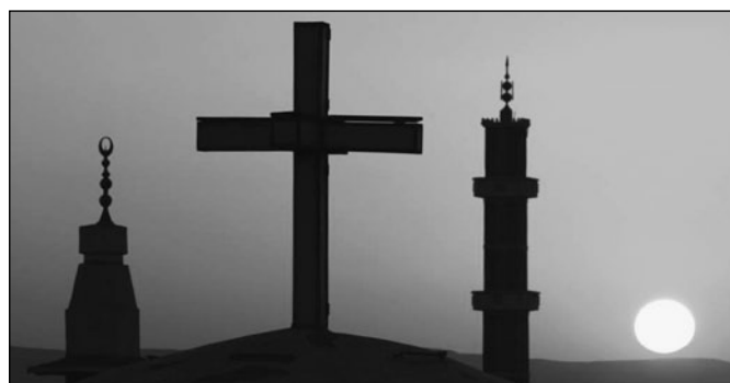
Vallások egymás mellett

Nemcsak az iszlám, hanem a kereszténység palettáján is éles törésvonal húzódik a fundamentalistáktól a liberálisokig terjedő skála két végpontja között. A