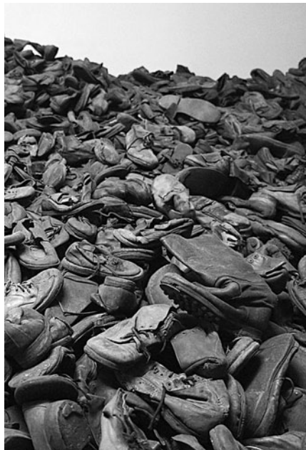
Megszámlálhatatlan: az auschwitzi haláltábor áldozatainak cipői

da lesz. Amikor végre az emberi szellem szabadon minden béklyótól és babonától, felemelkedhetik, ragyoghat. Végre minden megkötéstől mentesen, jöhet a boldog alkotás, a rend és az erény korszaka. De tévedtek a boldog jövőben bízók, mert fény és felemelkedés helyett igazságtalanság, jajszó és halál lepte el a földet. A technika valóban bámulatosan fejlődni kezdett, de a szalagmunka egyhangúságában, a fém sikításában a gép mögött elmaradt az erény. Valahogy a lehetőség a feltaláló ellen fordult, az alkotás az alkotójának mutatott görbe tükröt, és előrágatta legsötétebb arcunkat, azt, amit mérhetetlen ironiával „végső megoldásnak” neveztek el.