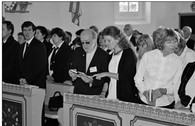
Ünnepi istentisztelet a székelykeresztúri templomban