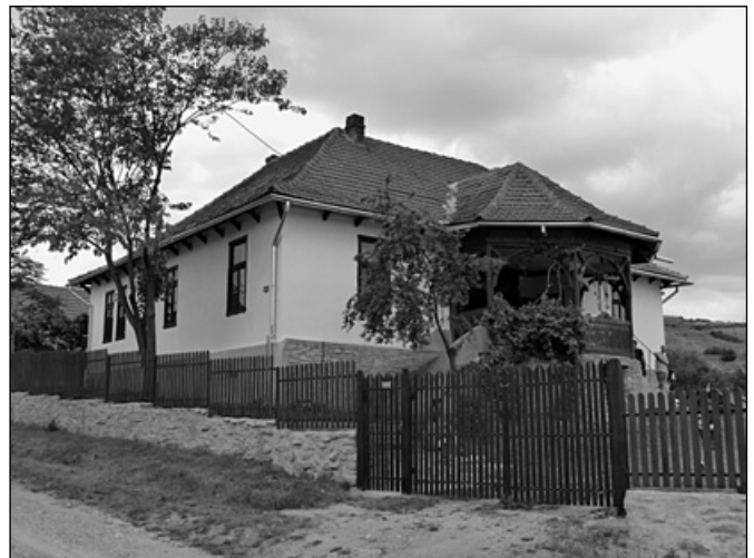
A felújított szindi paplak