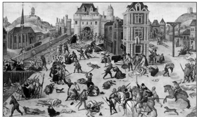
Szent Bertalan-éji mészárlás. François Dubois festménye

Franciaországban 1572. augusztus 14-re virradóan kerül sor arra az erőszakos cselekedetre, ami a Szent Bertalan-éji mészárlás címen vonult be a történelembe, és a francia hugenották ellen követték el a katolikusok. Lengyelországban a 17. században sor került a szociniánusok, vagy ahogy mi nevezzük őket, a lengyel unitáriusok felszámolására.