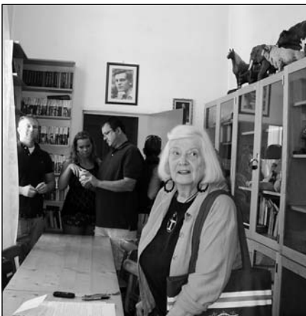
A Balázs Ferenc Oktatási Tanácsadó Központban