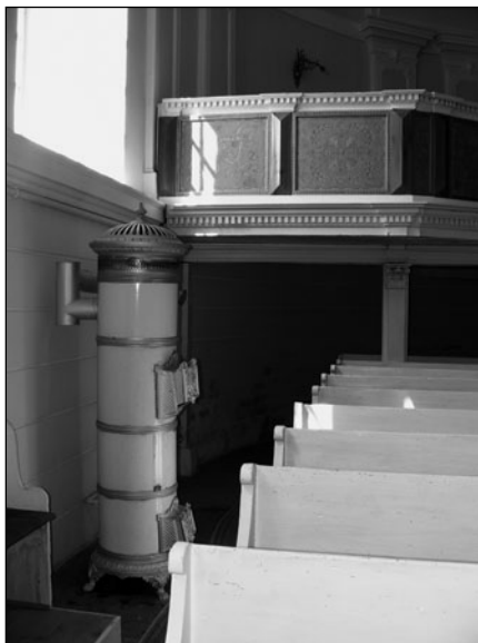
Zománcozott, öntött vaskályha a tordai unitárius templomban.

A műemlék-templomok nem rendelkeztek kéménnyel, ezért ezek helyét megfelelően kell megkeresni, és úgy felépíteni, hogy a templom külső megjelenését ne rontsák. Gázfűtés esetén csatlakoztatnunk kell a gázhálózathoz: ez további kihívást jelent, ugyanis ha a szerelést a gázművekre bízuk, és nem megfelelő szakember keresi meg a csövek helyét, való-