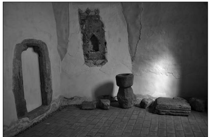
Páraáteresztő belső téglaburkolat, a fal mellett kialakított kavicsréteg (Sepsikilyén)

vagy a helyiség belsejében levő párazáró padló. A cement vagy betonpadló teljesen párazáró, de még a fapadló is sokban gátolja a talajvíz kipárolgását. A fal külső felére a járda mindenképpen apróbb kövekből vagy kavicsból készüljön – ekkor a talajvíz könnyebben kipárolog. A templom belsejében a falak mentén javasolt 10–20 cm kavicsréteg elhelyezése, ez szintén lehetővé teszi a talajban felgyűlő nedvesség kipárolgását, így kevesebb fog a falba bejutni, és felszívódni. A pinceszinttel nem rendelkező, azaz a töltésen kialakított járószintű épületek (általában a templomok) esetén legideálisabb a kőlapokból, vagy téglából kialakított padló. Kerülni kell a cementes betonpadlók, járdák készítését, illetve fölösleges jól vízszigetelő padlót elhelyezni olyan helyiségben, ahol a falban nincs vízszintes vízszigetelés.