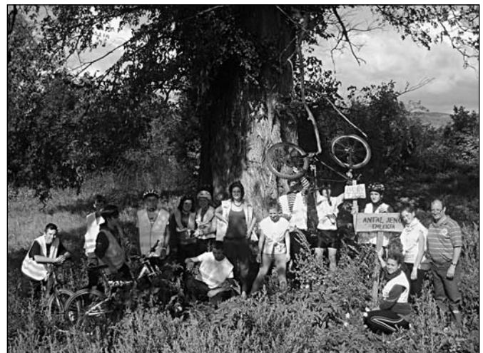
Csoportkép az Év fájánál, a köpeci színlél

Legyen velünk az Isten, hogy jövőre újra útnak indulhassunk, és újabb rejtett kincseket fedezhessünk fel.