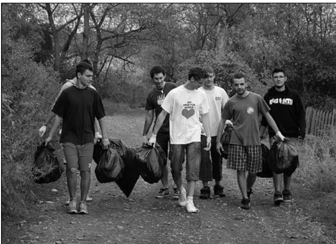
Vigyázunk a környezetünkre

Szombat reggel, még a Nap meg sem mutatta első sugarait, de a kis csapatunk már talpon volt és készen állt a megmérettetésekre. A reggeli áhítat után nekivágtunk egy többkilométeres túrának, amely során