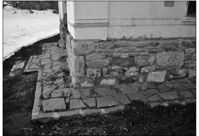
Külső kőlapokból készített járda (Sepsiszentkirály)

kemény, könnyebben reped. Keménysége valóban kisebb, de megjegyezzük, hogy előállításának módja, az adalékanyagok használata, valamint a felhordás technológiája sokat segít a vakolat minőségén. Sajnos a házgyári tapasztalatokon felnőtt, zsákos, előre előállított, cementes vakolatokhoz szokott mai mesterek egy részének nincs meg a megfelelő szakmai tudása, nem ismerik a mészvakolatok fortélyait, ezért próbáljunk megfelelő tudású, jól képzett vagy tapasztalattal rendelkező kőművest keresni.