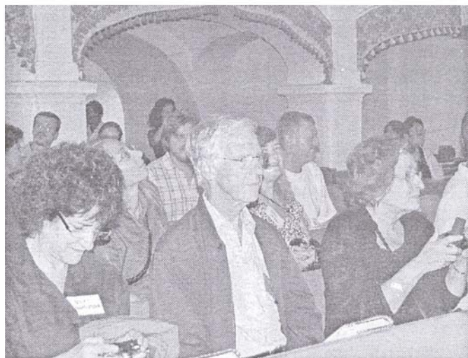
A torockószentgyörgyi templomban: ausztrál elmélyülés, amerikai fotózás.

A nemzetközi szervezet két évente tartott közgyűlésére a következő országokból jöttek: Anglia, Amerikai Egyesült Államok, Nigéria, Srí Lanka, Spanyolország, Kanada, Lengyelország, Ausztria, Németország, Magyar-