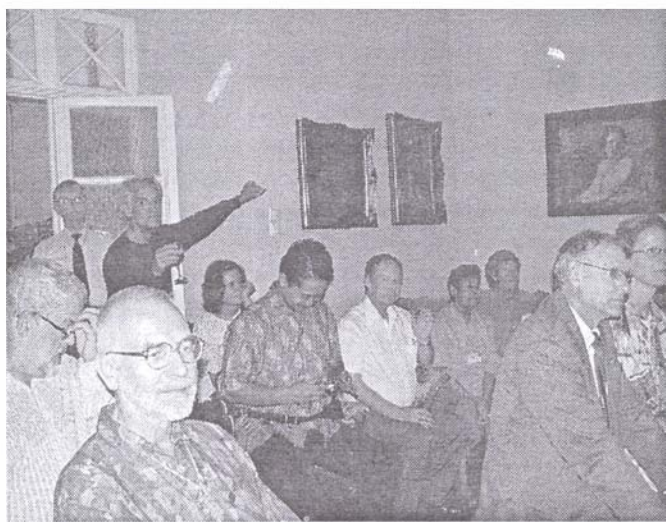
Műélvezet a püspöki házban: Thorma-képek alatt Brahms és Kodály