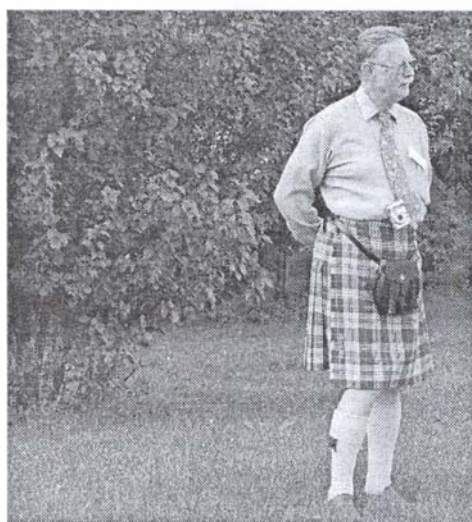
Az erdélyi természet és a skót népviselet egybesimulása a Szekelykő alatt

A közgyűlés az unitarizmust jellemző tolerancia és szabadság elvei alapján határozatban ítélte el a szeptember elsejétől életbe lépett szlovák nyelvtörvényt, és támogatásáról biztosította a felvidéki magyar közösséget. Emellett a Tanács felkérte tagságát, hogy külön-külön értesítsék saját államaik kormányzatát és közvéleményét a Szlovákiában kialakult kedvezőtlen helyzetről. Ugyanakkor értetlenül vettek tudomást arról, hogy a tordai múzeumban található Körösfői Kriesch Aladár festette A vallásszabadság kihirdetése az 1568. évi tordai országgyűlésen című festményt nem lehet megtekinteni. A múzeum tulajdonában levő kép tíz éve nem látható, úgynevezett restaurálási okokból. Az ICUU közgyűlése elfogadhatatlannak tartja, hogy Romániában egy közkincsnek számító műalkotást elrejtjenek ahelyett, hogy értékelnék és népszerűsíték. Határozatukban arra kér-