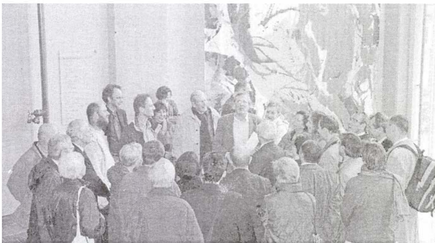
A groningeni egyetemi könyvtár igazgatója erdélyiek körében