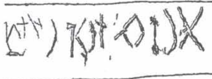
Rovásírás az egyik külső falfestmény keretén (Kónya Ádám rajza)

(Források: Kónya Ádám ny. múzeumigazgató előadása és korábbi tanulmánya a Keresztény Magvető -ben; Szabó Zoltán lelkész, közigazgatási ügyintéző „Püspökség Dokumentum. Protocollum – Generalis Visitationis in Tracta Haromszék.” Unitárius Közlöny , 1992 július–szeptember; Török Áron ny. lelkész cikke az Unitárius Közlöny 1993 január–márciusi számában.)