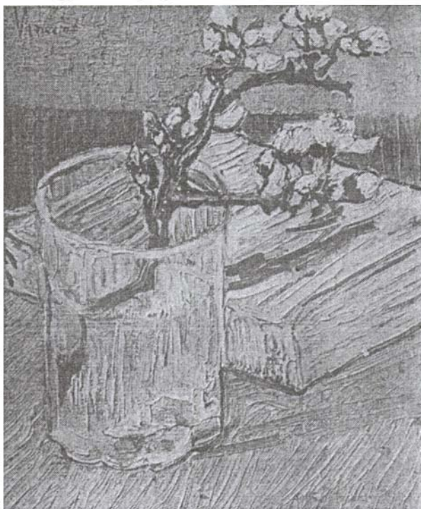
Vincent van Gogh: Virágzó mandulaág

Azt kell mondanunk, hogy ez a vonás nagymértékben jellemzi a modern embert is. Ha például azt kérdezzük, hogy mi érdekli korunk tudományát, a külső világ, vagy a belső világ, az anyag-e, vagy a szellem, azt kell felelnünk, hogy összehasonlíthatatlanul több tudóst foglalkoztat a világ külsejének a megismerése, mint a dolgok belsejének a felfedezése és megérzése. Az emberi gondolkodás a látható anyagi világ ismeretében hihetetlenül előre haladt, új meg új világokat tárt fel és hódított meg, ugyanakkor a szellemi élet birodalmából azt sem tudja megtartani, amit őseink magukévé tettek és reánk hagytak, s lassanként takarodót fúj és visszavonul. Például ezelőtt néhány száz esztendővel a vallási kérdések mindenki számára a legfontosabb kérdések voltak, sőt nemzetek sorsa, s az egész emberiség jóléte ilyen kérdéseken fordult meg. Ma pedig annyira összezsugorodtak és elveszítették érdekességüket, hogy a legtöbb művelt ember kevesebbet tud a saját vallásáról, mint pl. a vitaminokról vagy a titkos választójojról. Gondoljuk el, mit tett az emberi ész, hogy megismerje a nagy világmindenséget, és micsoda felfedezéseket tett a mikrokozmosz: az atomok világában, s eközben elnyomódtak lelkünkben olyan értékek, mint a szépség, a jóság, az igazság, a méltóság, a hit, a szeretet.