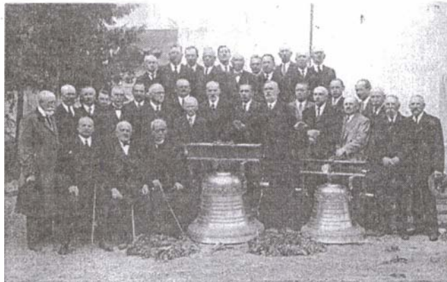
Harangszentelés – 1934. május 6.

Az elmúlt 210 év alatt templomunkban nagyon sok egyházi rendezvényt tartottak meg, és ezek közül csak egy párat említek: 1928. május 19–20-án a tordai unitárius templomban tartott zsinati Főtanácsi gyűlésen dr. Boros György főjegyzőt 203 szavazattal püspökké választották; 1934. má-