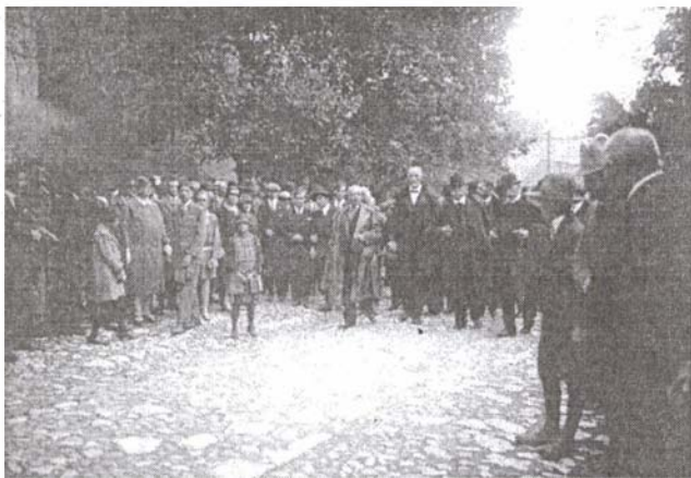
Boros György püspökké választása – 1928

Templomunk több alkalommal is javításra szorult: 1823–1870, 1903, 1946, 1968, 1975–1976, 1980, 1999–2000. A legnagyobb javítás 1999–2000 között volt, amikor híveink nagyon sok áldozatot hoztak Isten házána megjavítására. Hála és köszönet mindenkinek, aki bármilyen módon segített e nemes munkában, hogy templomunk méltó legyen a Dávid Ferenc-i eszmék hirdetésére, no meg arra, hogy Tordát továbbra is az unitáriusok Mekkájának tartsák.