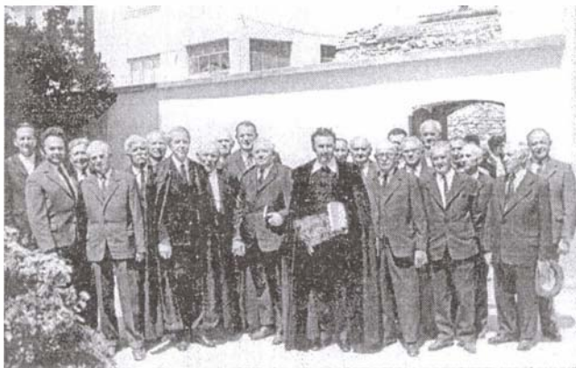
Püspöki vizitáció – 1980

jus 6-án volt templomunk harangjainak szentelése. Sajnos, a képen láthatók közül ma már senki sem él; a harmadik kép 1980-ban készült a püspöki látogatás alkalmával. E képen látható hívek közül is ma már csak négyen élnek.