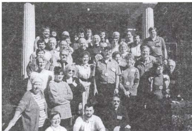
A konferencia résztvevői

A konferenciát bezáró áhítat után egy közös kiránduláson vettünk részt, melyen megcsodálhattuk Boston nevezetességeit. A búcsúvacsora után kiértékeljük az elhangzottakat, és reményünket fejeztük ki azt illetően, hogy e konferencián elhangzottak az erdélyi és amerikai testvéregyházközségek kapcsolatának szorosabbá tételét szolgálják majd.