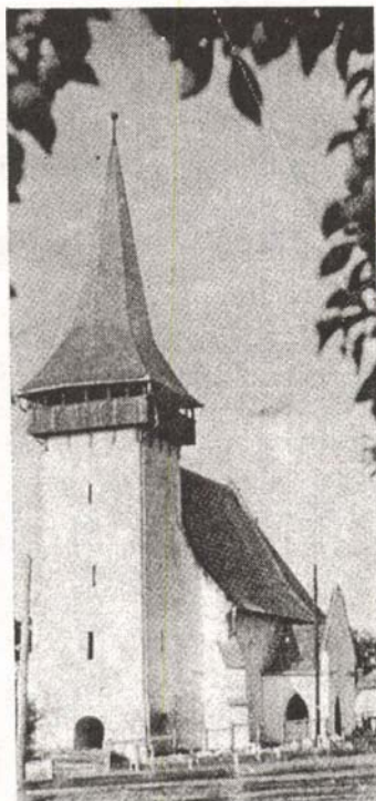
Ádámosi templom Épült a XV–XVI. században; 2873. sz. műemlék)

Az egyházi és művelődéstörténeti szakemberek javaslatára az ádámosi egyházközség, a millennium emlékére, tervbe vette a kazetták hiteles másolatának elkészítését és a templom mennyezetére való visszahelyezését, hogy ezek az értékek eredeti helyükön és környezetükben hordozzák majd az erdélyi magyar művelődés ősi emlékeit.