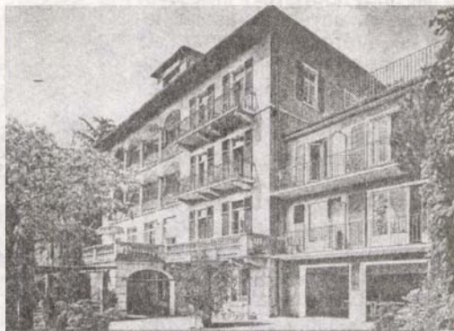
Bruchmatt ház - Luzern

A zsúfolt programban - lazításként - egy kirándulás a svájci alpokban, egy iskolai jubileumi ünnepségen való rész-