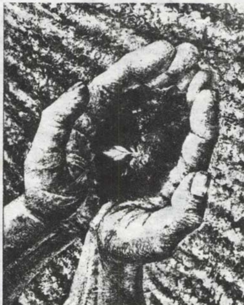
Csutak Levente: új hajtás