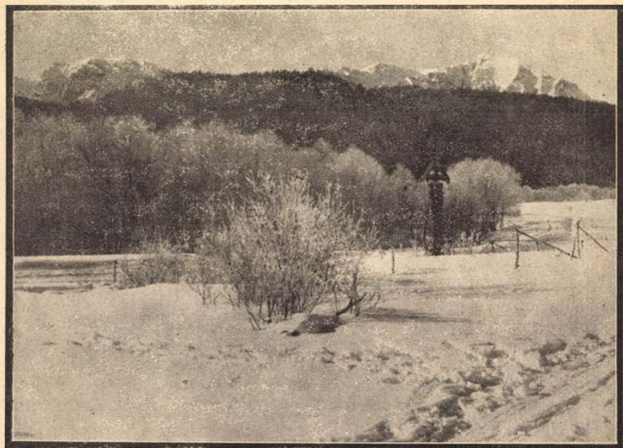
Téli táj Braşov mellett.