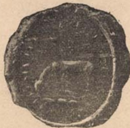
Msztkirályi e. p.