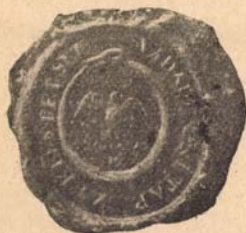
Vadadi e. p.