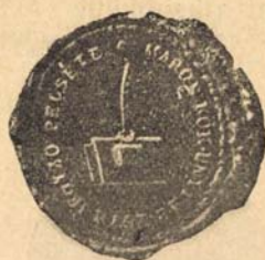
Marosköri jegyző p.