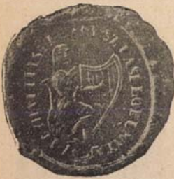
Szentlászlii e. p.

mindig, de legüdvösebben érezte az 1880. évi október 2—20-ik napjaiban, midőn első püspöki látogató körutját nálunk tartotta, bejárta a halban bővelkedő Maros, szőke Nyárád, Kis-Küküllő kies völgyein s a Mezőség egy virányos zugában fekvő egyházközségeinket. Mindjárt a második nap reggelén előre földingás jelezte a szívek és lelkek mély megindulását.