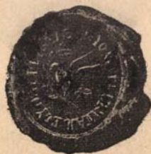
Szabédli e. p.

később alakult marosvásárhelyi egyházközség pecsétnyomója 1880-ban készült, közepén egy kehelyvel.]