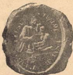
Iklandi e. p.