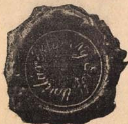
Ny-gálfalvi e. p.

szett volt. Az alpapiszéki és nyárádgyátfalvi pecsétnyomók későbbi metszetek; amaz a törvénykönyv jelképével, ez jelkép nélkül. A