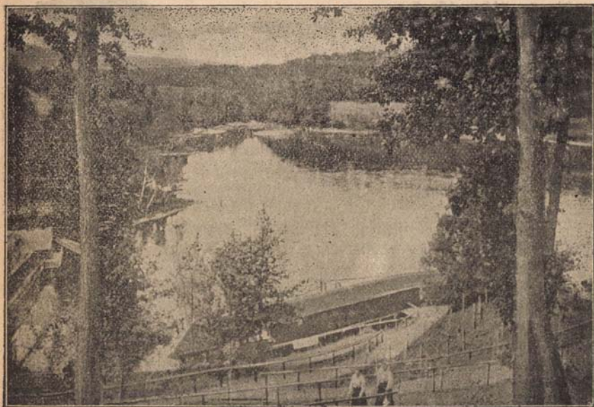
Szováta fürdő. (Medve tó a cukrázdából nézve.)

Hatalmas szép erdők, virághímes mezők, kristálytisza vizek, hullámzó sóstavak ti vonzatak minket! Bennetek nyil-