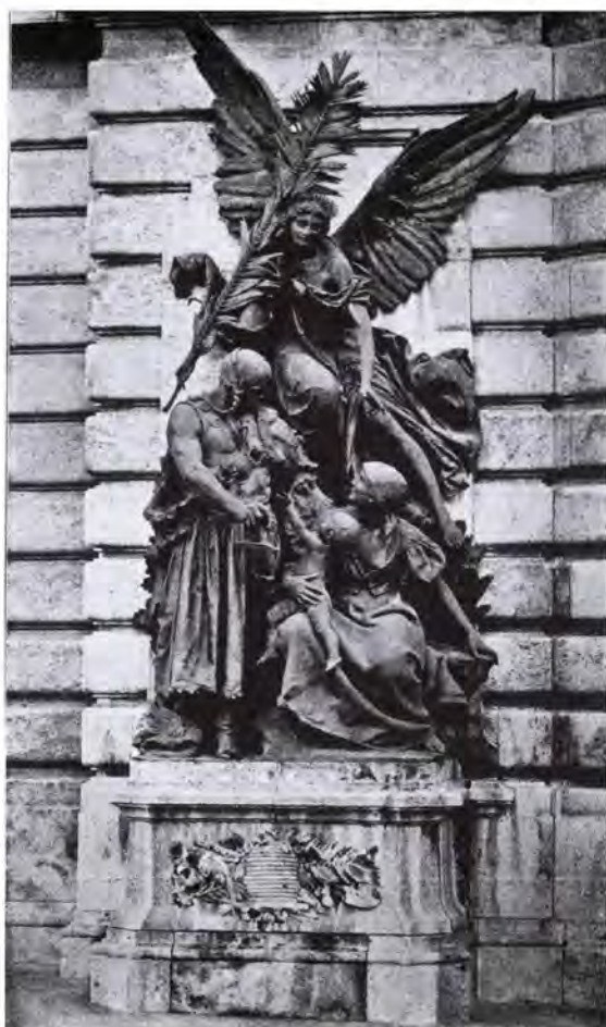
6. Senyei Károly: A Béke allegóriájának szobra a budavári palota déli szárnyának nyugati bejáratánál.

A krisztinavárosi palota díszítésében ez a gondolat, ha nem is kiélezett formában, de világosan megjelenik a pogány harcosok szerepeltetésében: Fadrusz János magyaros pogány Atlasz -szobraiban és a Háború vagy a Béke Senyei-féle szoborcsoportjában. (5–6. képek) Hauszmann azonban a művészi dekorációban nem adott több teret ennek a gondolatnak, sőt, minden olyan esetben, ahol erre könnyűszerrel lehetősége lett volna, éppen, hogy tompította ezt. 29 Így volt ez a Szent István-terem esetében is.