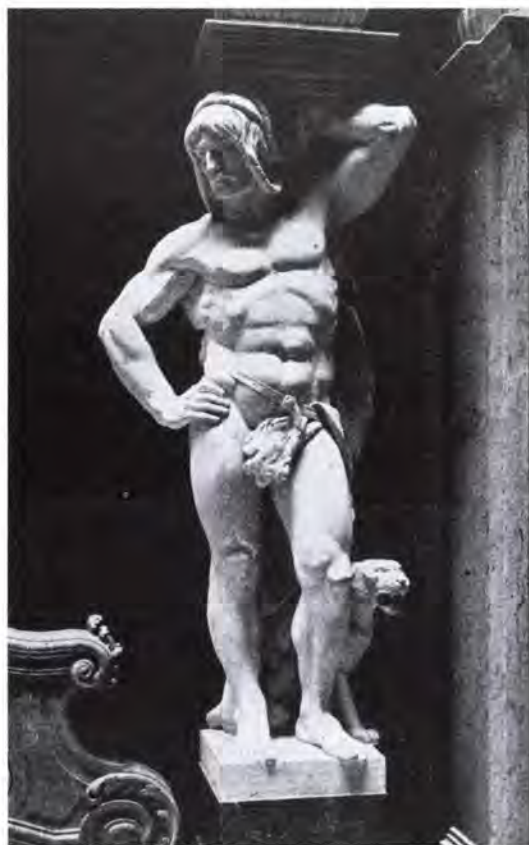
5. Fadrusz János: Atlasz-szobor a budavári palota krisztinavárosi szárnyában.

„Ha végig tekintünk az Árpád-házi királyok során, két típust különböztetünk meg. Az egyik nyugodt, komoly, kissé rideg tiszta keleti faj, mint újabb történetünkben Deák Ferencz, a költők közt Arany János; a másik elevenebb, tüzes, nemcsak lelkes, de másokat is tud lelkesíteni; megátszik rajta, hogy az ázsiai magyarba könnyebb — szláv — vér vegyült, mint meglátszik Kossuth Lajoson vagy Petőfi Sándoron. Mindkettőben megvan azonban a magyar faj jellemző vonása: hogy úr; van benne méltóság, erő; van akaratja, tud parancsolni, és — ha el nem lustul — cselekedni, csak hogy az egyik tevékenysége izzó parázs, a másiké lángoló tűz. Szent István, aki Magyarországot megalapította, és Szent László, a daliás hős, ki az ország minden szomszédjával diadalmasan megverekedett — mintegy megdicsőült típusai e két árnyalatnak.”