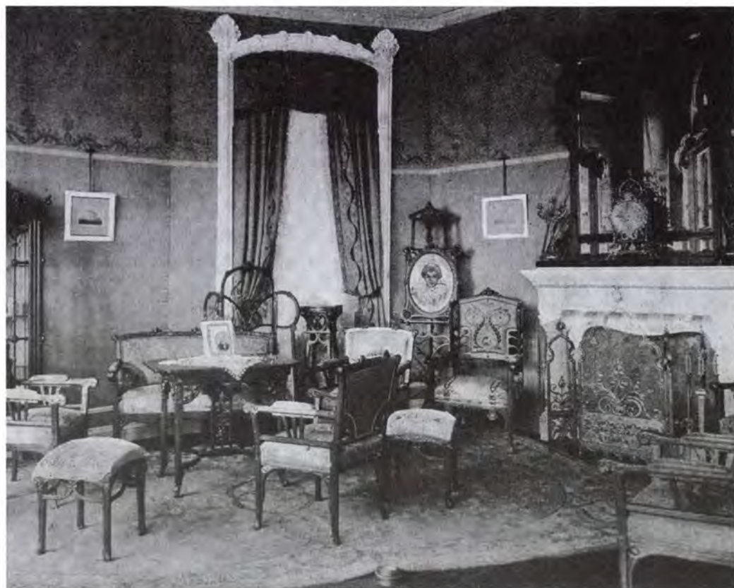
16. Faragó Ödön által tervezett enteriőr Magyar Iparművészet, 1900

Az idézet és Hauszmann elbeszélése inkább a főépítész kultúrdiplomáciai érzékéről szól, és kevésbé a tényleges történésekről, hiszen a parasztház csak négy évvel a királyné halála után készült el, bár az 1899–1900-ban tervezett és elkészített bútorokat már az