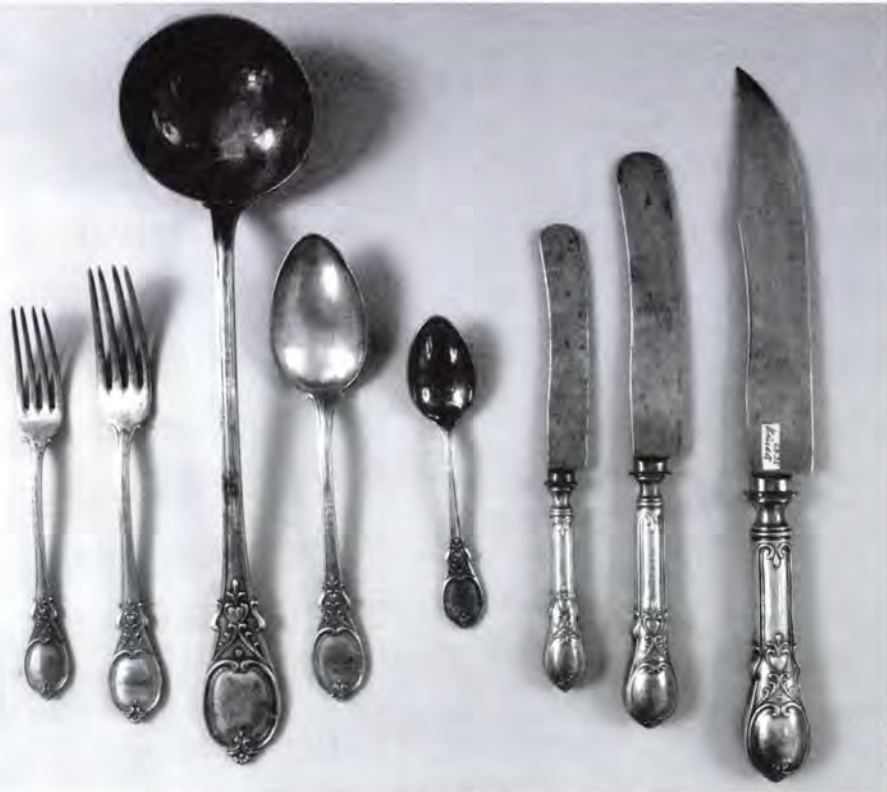
10. Evőeszközök a budavári palotából, 1900 körül. BTM Kiscelli Múzeuma, ezüstgyűjtemény, lt.: Ip. 67.21.3.

Ha Hauszmann felfogását az 1885-ös Országos Kiállítás után kirobbant ornamentika-vita koordinátái között akarnánk elhelyezni, akkor azt egyértelműen a Pulszky Károly által képviselt liberális állásponthez kellene közelítenünk. 44