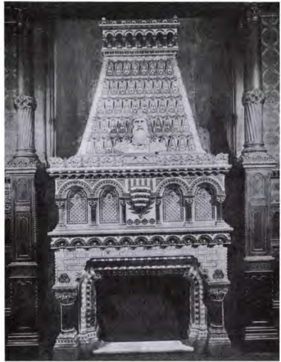
7. A Szent István-terem kandallója. Magyar Iparművészet, 1900, 96.

A terem díszítésének ikonográfiája is kifejezi a történetfelfogások különbségét. Kecskeméten pl. Székely Bertalan a honfoglaló magyar vezérek vérszerződését ábrázolta a közgyűlési teremben I. Ferenc József koronázási jelenetével átellenben, és a falakon olyan, a függetlenségi párti történetfelfogás által preferált személyeket is ábrázolt, akik a budai királyi palota berendezésében egyáltalán nem jelentek meg ( Thököly Imre, Bethlen Gábor, II. Rákóczi Ferenc, Kossuth Lajos, Széchenyi István ). A kecskeméti városháza Rathausmannjának szerepében pedig Árpád vezér figurája kapott helyett. 38