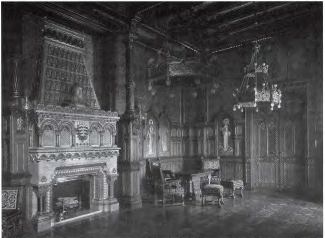
2. A Szent István-terem, 1900-as évek

az összehangolására is törekedett. Hauszmann finom megfogalmazásában ez így hangzott 3 : „Törekvésünk az, hogy e büszke vár ... a magyar szent koronához méltó alakban nemzetünknek a trónhoz való ragaszkodásával együtt, egyszersmind hirdetője legyen a magyar kultúrának és művészetnek.”