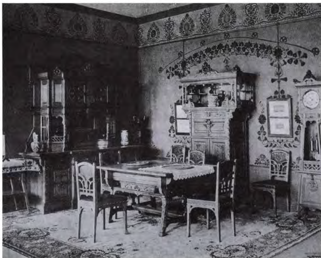
15. Faragó Ödön által tervezett interiőr Magyar Iparművészet, 1900

E program Mátyást reneszánsz uralkodóként állította be. Hódításai éppen úgy köszönhetőek voltak hadi tetteinek — olvasható le a vázsnakról —, mint diplomáciai bölcsességének. Csatakép és Bécs elfoglalására nyíltan utaló jelenet egyáltalán nem szerepelt a képciklusban. Mindazonáltal ez utóbbira való utalás azért nem hiányzik a programból. A pápa követének fogadása jelenet történeti alapja ugyanis vagy az a momentum, amikor Mátyás, a III. Frigyes elleni győzedelmes alsó-ausztiai hadjárat közepette fogadta IV. Sixtus pápa követét, Castello püspököt, vagy egyenesen a VIII. Ince pápa által Bécsbe, Mátyás rezidenciájába küldött Angelo Pecchinoli ortei püspök látogatása 1489-ben. Az ábrázolt jelenet ebben az esetben a bécsi Burgban játszódik! 62 Ugyanakkor a Mátyás-kultusz császárhű aspektusát volt hivatott hangsúlyozni a Mátyás és Holubar viadalát bemutató jelenet. Ennek ugyanis, amint ezt Bellák Gábor kutatásaiból tudjuk, egy kortárs kosztümös ünnepély volt az inspiráló forrása, nevezetesen a Tattersalban rendezett lovagi torna 1902. május 16—17-én, ahol maga a császár és a Bécsben élő főhercegek is megjelentek. Az eseményről kiadott prospektusban Holló Tivadar meg is fogalmazta az egész történeti mulatság eszméjét: „egyesült a király a magyarsággal Hollós Mátyás kultuszában”. 63 Így tehát a nemzeti függetlenségnek és büszkeségnek rendelt teremben Benczúr festményei is ügyesen egyensúlyozták ki a politikai ellenerőket.