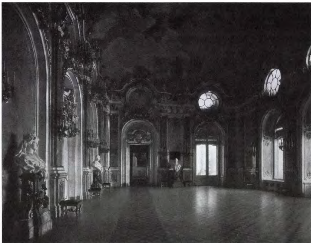
1. A Habsburg-terem, 1900-as évek.

A budavári királyi palota díszítőprogramjának megalkotásában a 19. század végén az egyik alapvető feladat a nemzeti palota és az uralkodói rezidencia kettős funkciójának kifejezése volt. Az épületkomplexum dekorációjában voltak politikasemleges elemek, amelyek az adott épületrész vagy terem gyakorlati funkcióját 1 vagy általános uralkodói szimbólumokat jelenítettek meg. 2 Tekintettel azonban arra, hogy I. Ferenc József személye, illetve az 1848-tól tartó uralkodása a nemzeti ellenállás, illetve a legitim uralkodó iránti lojalitás állandó ambivalens érzésének jegyében zajlott, a palota belső díszítése ezeknek a szempontoknak