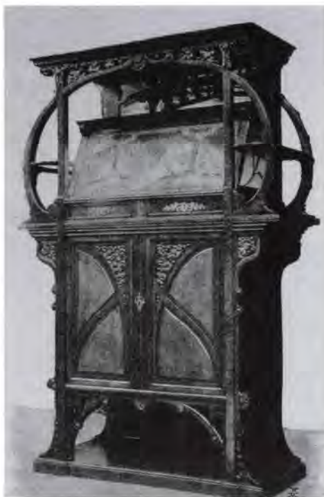
17. Faragó Ödön: Szalonszekrény (Magyar Iparművészet, 1900)

1900. évi párizsi világkiállításon bemutatták. 66 (14. kép) A királynéra való hivatkozás Hauszmann számára mintegy jogalapot teremtett, hogy teret adjon az ún. „modern szubjektív” stílusiránynak, azaz a szecesszióknak. 67 A parasztháznak igen kevés köze volt az akkoriban már egyre inkább előtérbe kerülő etnográfiai kutatásokon, felméréseken alapuló népies stílushoz.