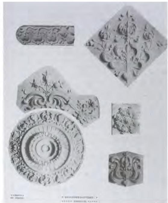
9. Stukkómotívumok a budavári palota Hauszmann-féle átépítéséből (tervező: Györgyi Géza).