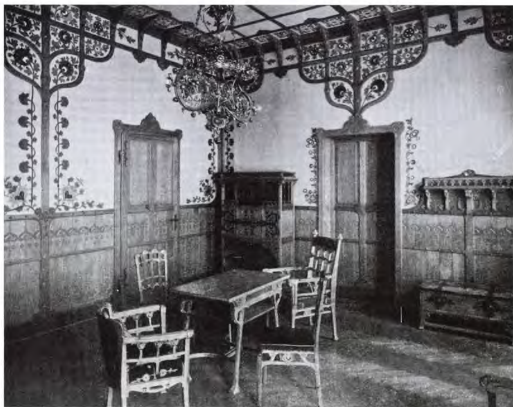
14. A parasztház enteriőrije. Magyar Iparművészet, 1903

Ugyanezt a „duplafenekű”, finom kétértelműségekkel tűzdelt ikonográfiai programot látjuk a Benczúr Gyulától megrendelt festészeti programban. Mint ismeretes, a tervezett nyolc vászonképből csak kettő készült el: Mátyás fogadja a pápa követeit és a Dicsőséges Mátyás (Mátyás bevonulása Budára) című. 60 Ismert továbbá egy vászonra skiccelt, a megvalósultakéval együtt összesen hat falkép vázlat, valamint az elkészült nyolc különálló vázlat közül három. 61