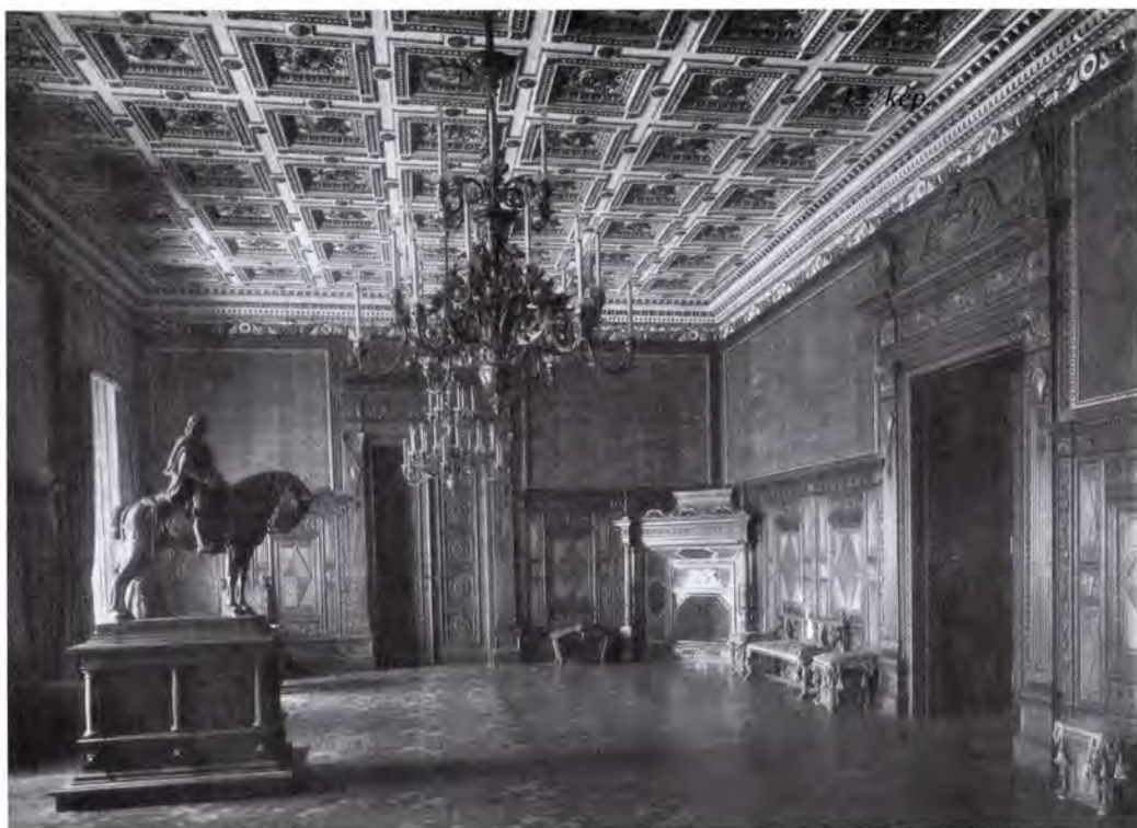
3. A Hunyadi Mátyás-terem, 1900-as évek.

kezdve a dinasztiaalapítón — a kápolnában egy márványtáblán sorolták fel. 6 A sírkápolna megépítése után fennmaradó 3000 forintból pedig egy díszalbumot adtak ki III. Béláról. 7