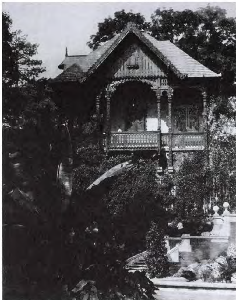
13. Az ún. parasztház a budavári palota déli kertjében.

volt mindjárt a kezdetektől. Egyfelől már a szoboralap gyűjtésekor összecsengett a Mátyás-kultusz Habsburg-ellenes, kurucos szólamával. A király nem is jelent meg az avatási ceremónián, mert tartani lehetett attól, hogy az ünnepély Habsburg-ellenes demonstrációvá fajul. 54 És valóban, a Gott erhaltét játszó zenekart a tömeg a magyar himnusz és a Kossuth-nóta éneklésével kontrázta, úgy hogy a rendőrök kardlapozva oszlatták a tüntetőket. A császárt képviselő József Ágost főherceget pedig — Laczkó Géza visszaemlékezése szerint — a kolozsvári diákság egy kurucos rigmussal köszöntötte. 55