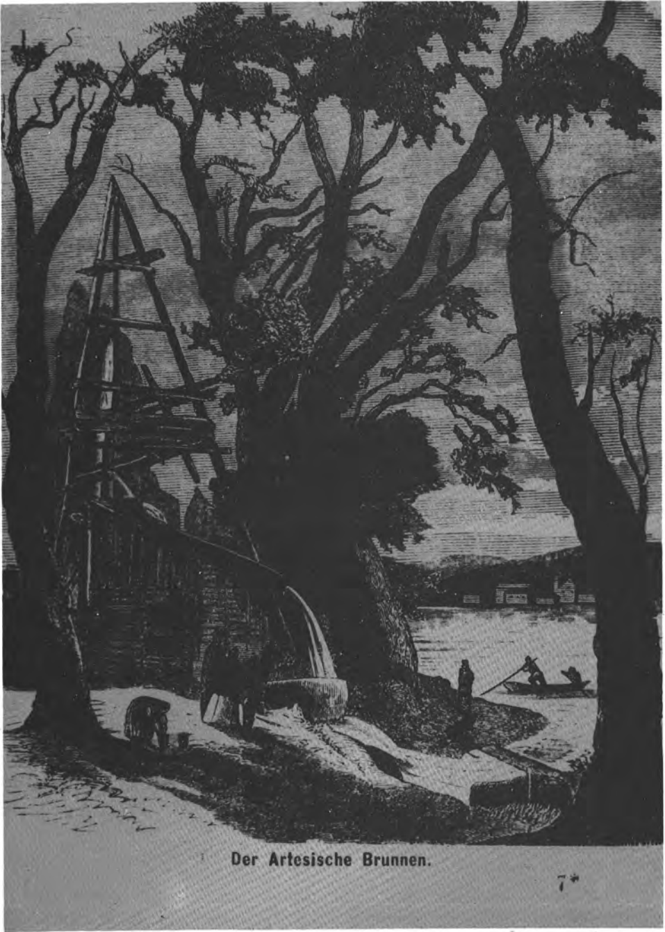
Der Artesische Brunnen.