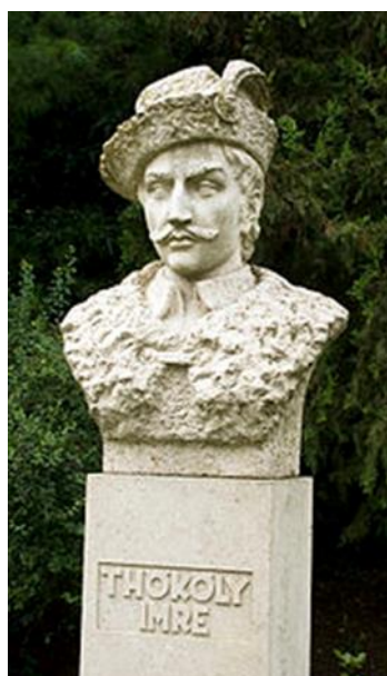
5. ábra: Thököly Imre mellszobra a vajai várban.