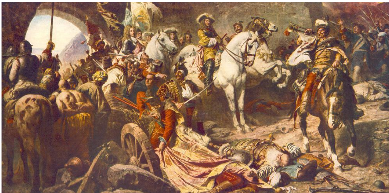
1. ábra: Benczúr Gyula: Budavár visszavétele a töröktől 1686-ban (részlet) 1896.

romantikus történelmi festészet vezető képviselőinek: Benczúr Gyulának, Madarász Viktornak, Székely Bertalannak és Than Mórnak a munkásságáról sem. Témánk szempontjából különleges jelentőséggel bír Benczúr Gyulának az 1896-os milleniumi évfordulóra készült Budavár visszavétele című festménye (1. ábra).