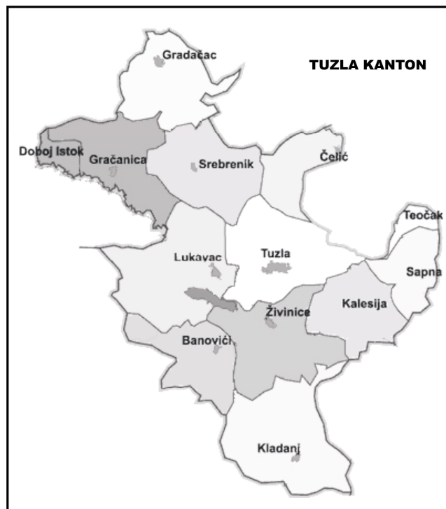
1. ábra. Bosznia-Hercegovina és Tuzla kanton közigazgatási beosztása Forrás: http_1 és http_2 alapján szerk. KOLUTÁ CZ A. 2009.