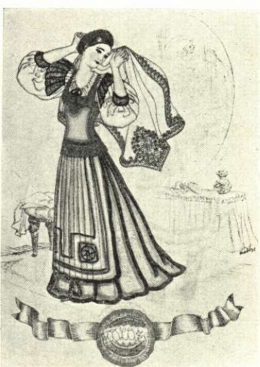
Selyemszoknya, szalagos kötény, piros csipkés zöldatlasz mellre való Officina kiadás