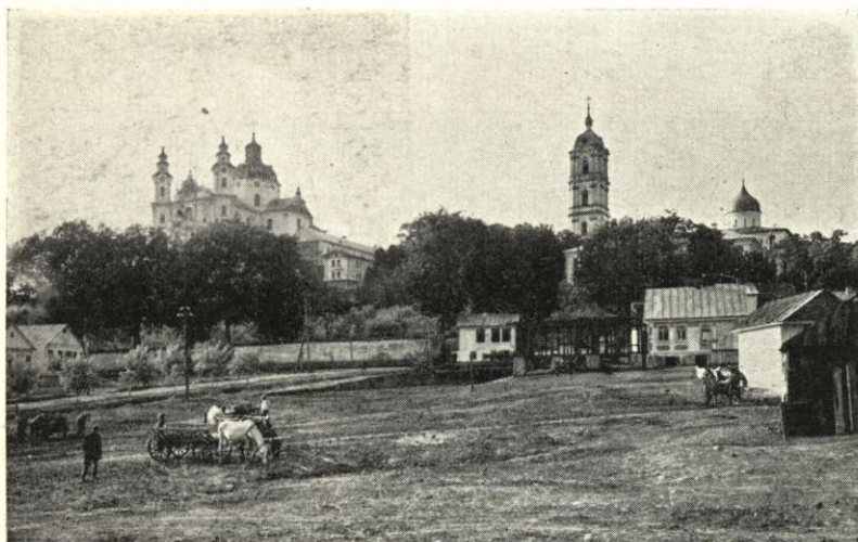
Krzemieniec képe a Liceummal a Slowacki-év ünnepeinek középpontja