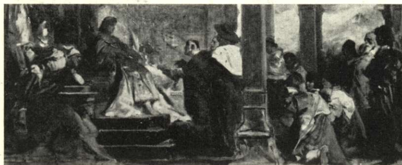
Benczur Gyula: Mátyás fogadja a pápa követét