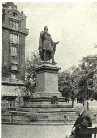
Báró Eötvös József szobra.