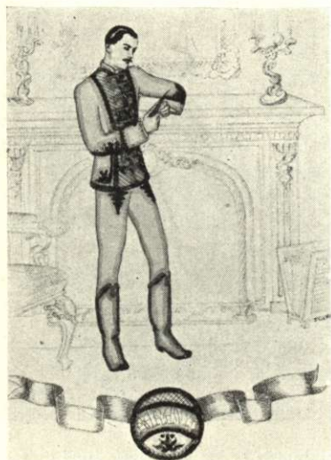
Barna filcrátéttel díszített drap posztódolmány (Baranyamegyei motívum)

Zs. Tüdös Klára tervei alapján rajzolta Szabó Gabriella