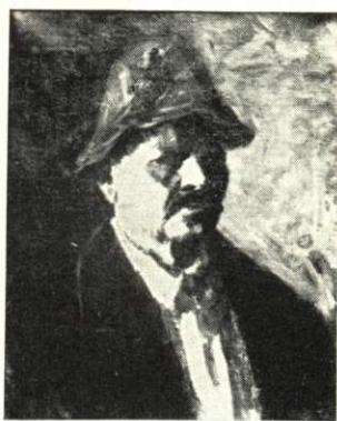
Kosztai József: Önarckép