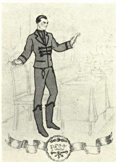
Kecskeméti paszományozással díszített fekete posztókabát, ezüstpitykés posztómellény