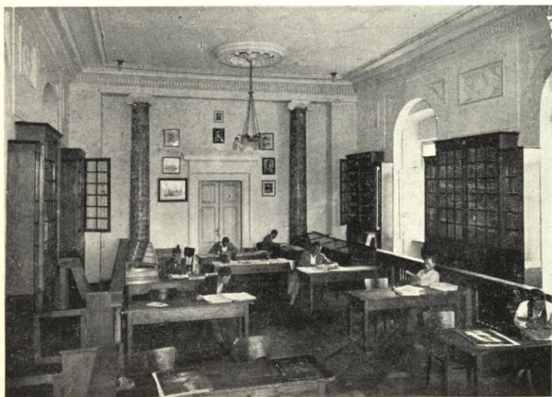
A krzemienieci Liceum olvasóterme