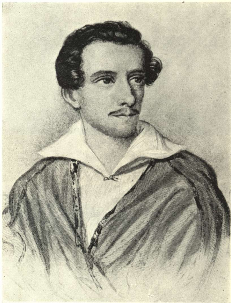
Juliusz Slowacki, a nagy lengyel nemzeti költő (1809—1849)