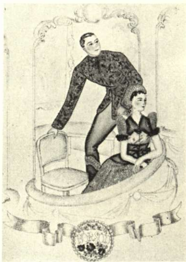
Mezőkövesdi mintás fekete férfidolmány, türkizbrokát női ruha, kövesdi aranyhímzéses kötény