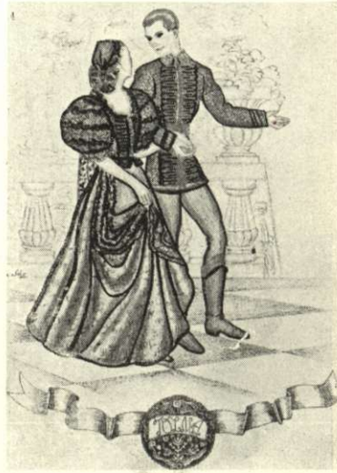
Sárközi mintás ingváll, kötény, zsinórozott bársonyderék. Aranyszarufás sujtásosású férfidolmány