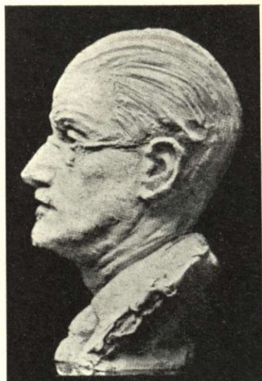
James Joyce angol író, a Finnegan ébredésének szerzője.