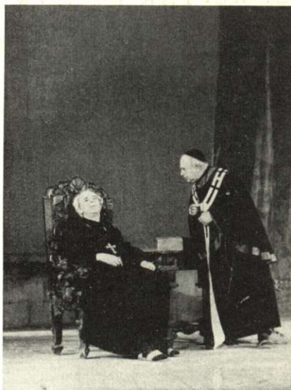
Németh László: VII. Gergely (Nemzeti Színház) Timár József, Gabányi László.