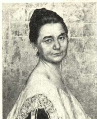
Karlovszky Bertalan: Női arckép