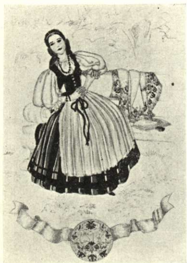
Csiki csíkos háziszóttos gyapjúszoknya, fekete bársonydíszes derék