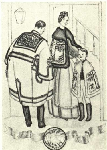
Világos posztó hajdúsági szűr fekete rátéttel, sárga női kisbunda, fehér bársony gyermekködmön