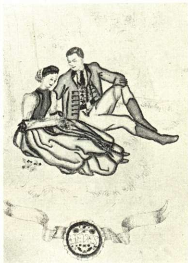
Szilvakék férfikabát bársony kihajtóval. Meggypiros szintjászó női ruha, aranycsipkés derék (Heves m.)

Zs. Tüdős Klára tervei alapján rajzolta Szabó Gabriella