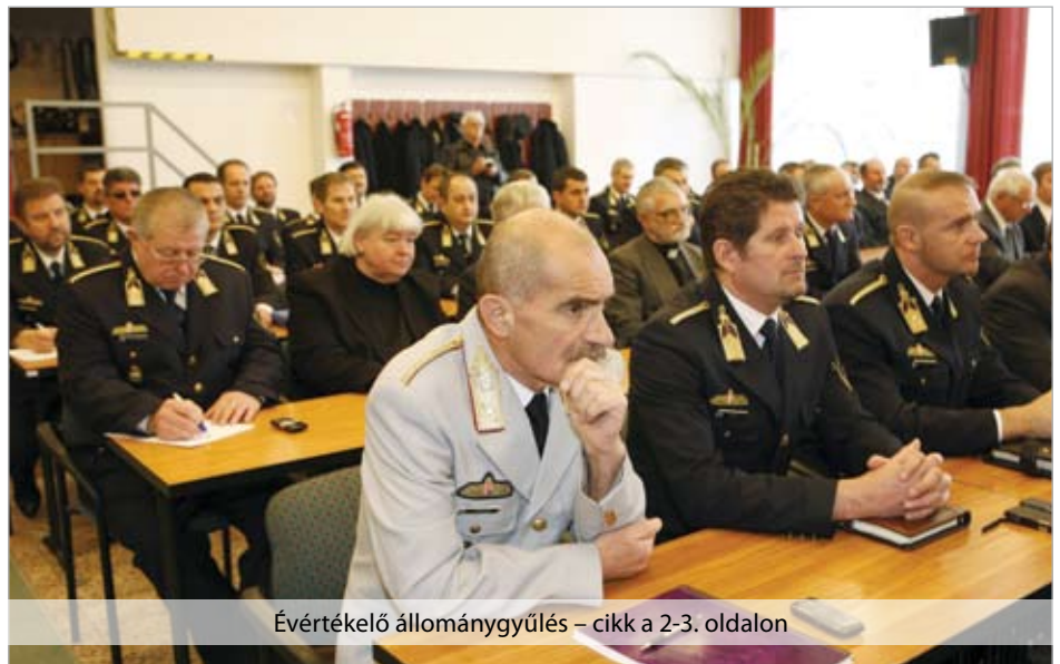
Évértékelő állománygyűlés – cikk a 2-3. oldalon