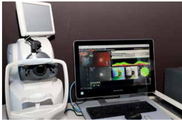
OCT szemfenék vizsgáló