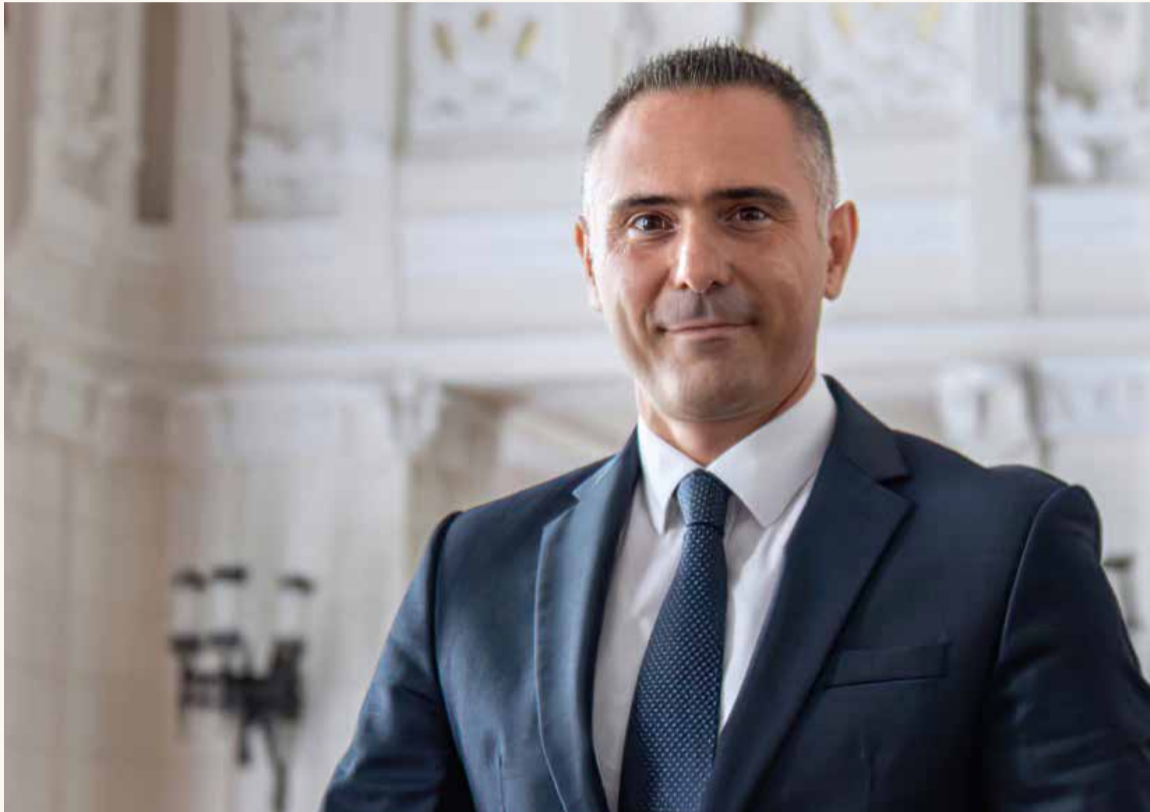
Dr. Trippon Norbert gazdaságért, költségvetésért, városüzemeltetésért és projektmenedzsmentért felelős alpolgármester

A karácsony, a szilveszter és az új év az ünneplés mellett az összegzés, a számvetés ideje is. Az Újpesti Napló arra kérte városvezetőinket, mondják el ünnepi gondolataikat.