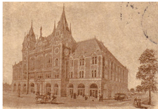
Az új község háza látványterve képeslapon Schön Bernát kiadásában