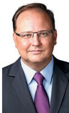
Wintermantel Zsolt polgármester

„A jövőt tervezték és építették bele. Mindentféle nagyozolás nélkül állíthatom, az Újpesti Piac és a vele együtt, de tőle azért külön működő UP Rendezvénytér olyan technológiákat rejt, amilyeneket csak alig találhatunk nemcsak Magyarországon, de Közép-Európában is.