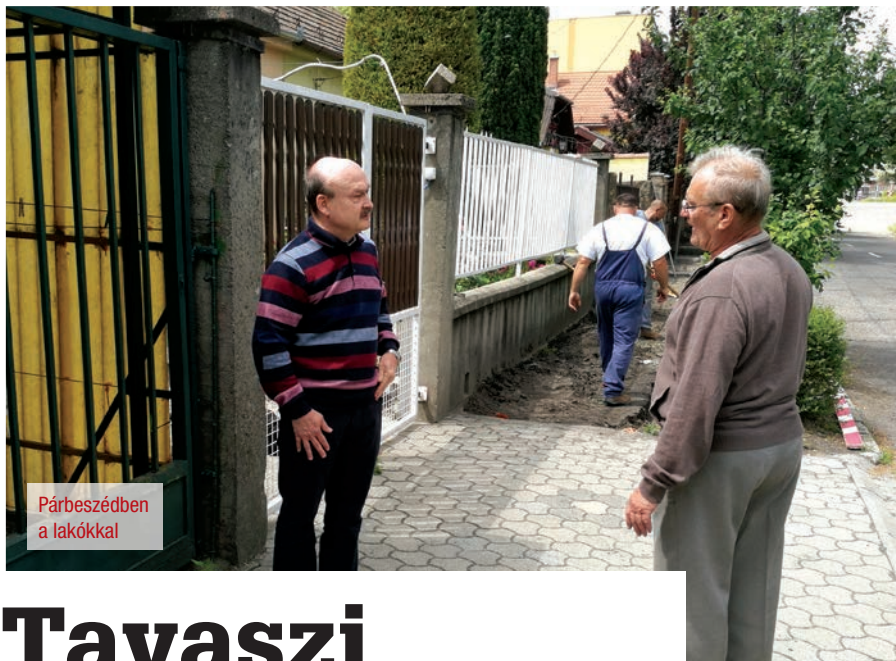
Párbeszédben a lakókkal