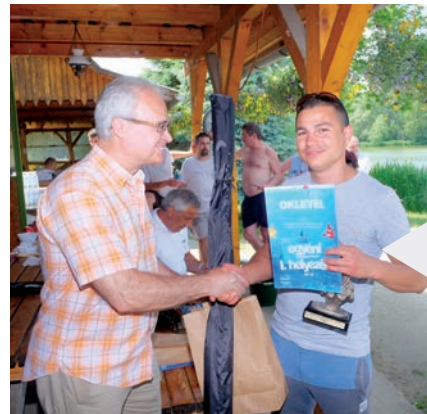
Íme az idei Horgászverseny egyéni kategóriájának büszke győztese