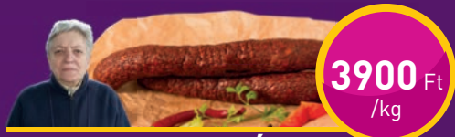
MANGALICAKOLBÁSZ Vadász Kamrája Kft.-nél

Az ÚJPESTI SZENT ISTVÁN TÉRI PIAC és VÁSÁRCSARNOK ajánlatai 2018. május 17-23.