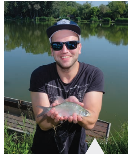
A nap legnagyobb fogása...ja, mégsem