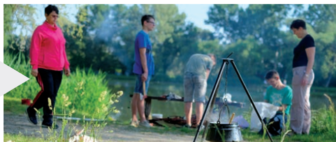
Vajon mi készül a bográcsban?

Talán ezek a szavak jellemzik legjobban a 2018-as horgászversenyt, melynek ismét a Csömöri horgászklub adott otthont. A korai kezdés ellenére – hiszen mikor máskor lehetne elindítani egy horgászversenyt – rengetegen érkeztek, és ami külön meglepetés, hogy ezúttal a fiatalabb korosztály is szép számmal képviseltette magát.