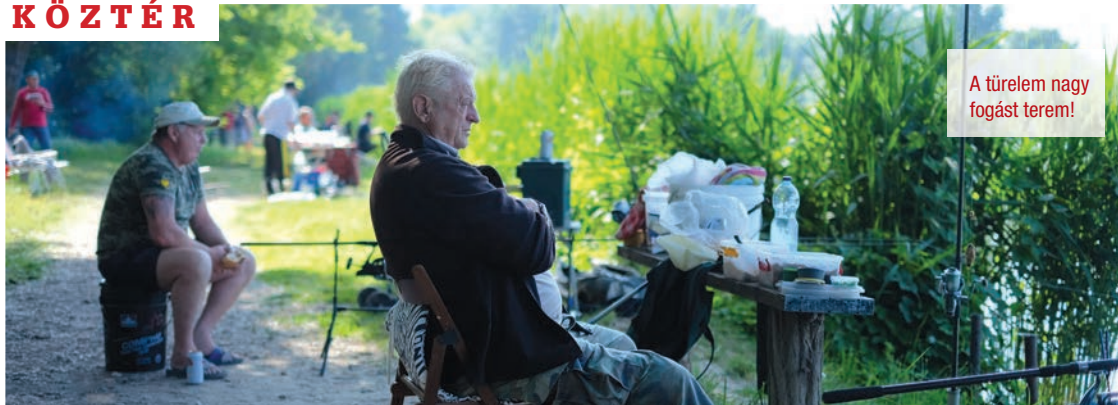
A türelem nagy fogást terem!