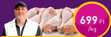
CSIRKECOMB Te-So Bt.-nél