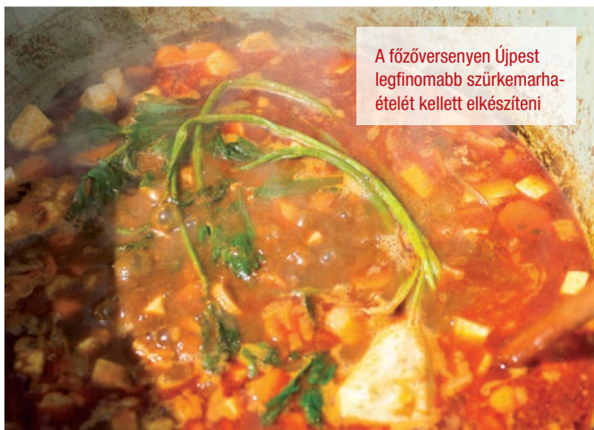
A főzőversenyen Újpest legfinomabb szürkemarkarha-ételét kellett elkészíteni