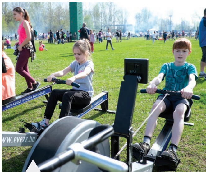
A gyerekeket egész nap sportos pontgyűjtőversennyel várták a szervezők