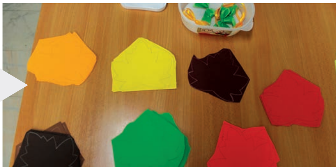
Ti melyik színt választanátok?