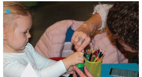
Szerencsére közel volt a segítség

November 4-én Rajzfilmünnepp volt az Ady Endre Művelődési Házban. A program 10 órától kezdődött klasszikus mesesorozatok vetítésével, ezután a gyerekek összeállítását tekinthették meg a Kecskeméti Animációs Filmfesztivál 2017-es díjnyertes filmjeiből, később pedig családi mozizás következett, ahol megnézhetők a Messzi Évszak és a Vuk című animációs filmeket. Eközben az aulában a legkisebbek gyurmázhattak, rajzolhattak, kifestőzhettek és még az arcukat is kifesthették. MG