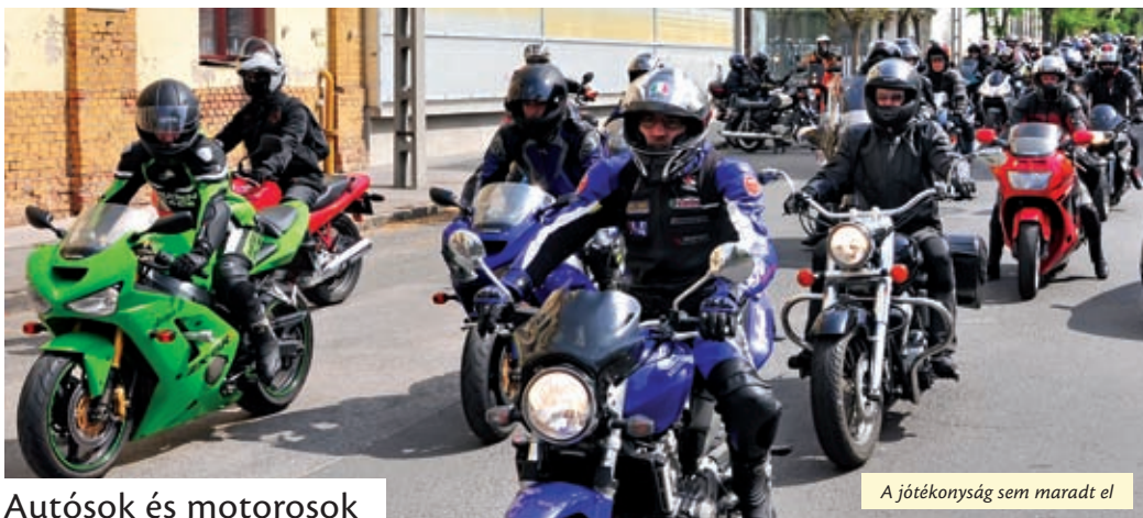
Autósok és motorosok