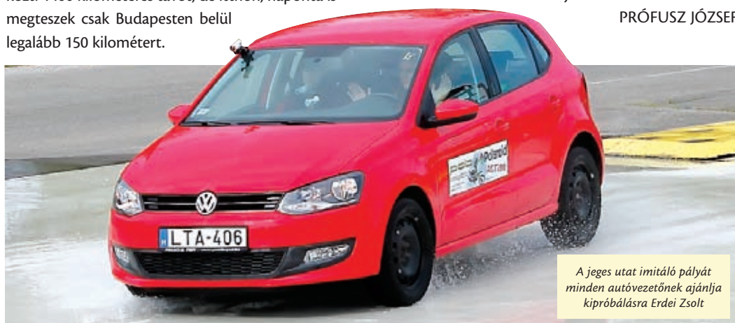
A jeges utat imitáló pályát minden autóvezetőnek ajánlja kipróbálásra Erdei Zolt