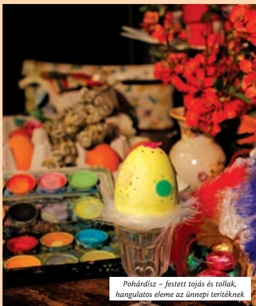
Pohárdisz – festett tojás és tollak, hangulatos eleme az ünnepi terítéknek