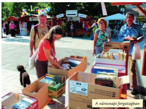
A városnapi forgatagban