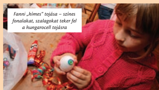
Fanni „hímes” tojása – színes fonalakat, szalagokat teker fel a hungarocell tojásra

A rajziskola fiataljai ötletben gazdag ajándékokat készítettek, akinek tetszik, ne této-vázzon, van még idő húsvét hétfőig. A hozzávalók: keményre főtt tojás vagy átlátszó plasztiktojás, hungarocell tojás. Tempera, ragasztó, színes fonál, rafia, ecset, színes papír, tűfilc, színes minyon- vagy tortapapír és nem kevés leleményesség. B. K.