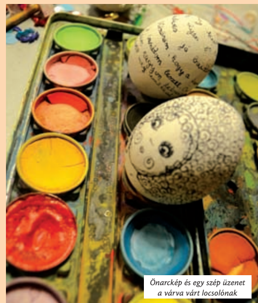
Önarckép és egy szép üzenet a várva várt locsolónak