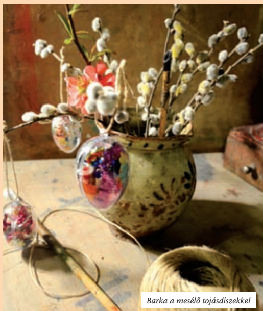
Barka a mesélő tojásdíszekkel