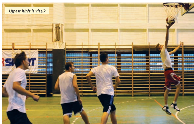
Újpest híret is viszik