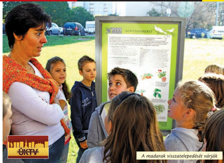
A madarak visszatelphetését várják