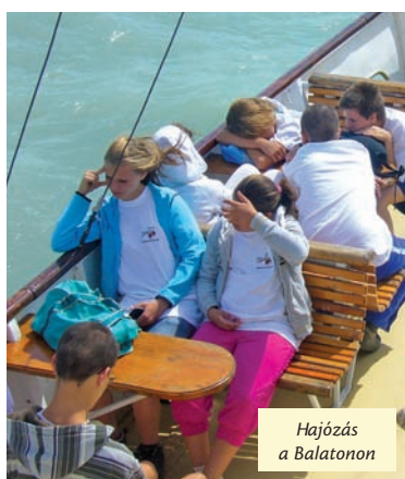
Hajózás a Balatonon