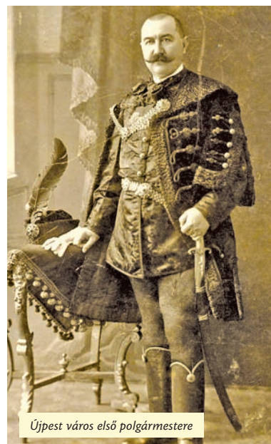
Újpest város első polgármestere

A könyv 1932. március 21-én kelt előszavában Preszly Elemér , Pest megye főispánja így fogalmaz: „ Újpest százszentendős története az optimizmus himnuszát zengi a lelkünkbe [...] Száz év előtt néhány szerény ház állott a mai Újpest helyén: szegény telepesek voltak itt, csak a ház felüléptménye volt a tulajdonuk, a telkek már nem, azok a grófi uradalom tulajdonai voltak. Ma pedig hetvenezer lakosu, egészséges, tiszta, élénk város áll