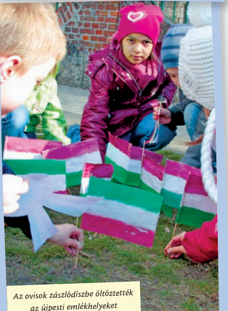
Az ovisok zászlódszíbe öltöztették az újpesti emlékhelyeket