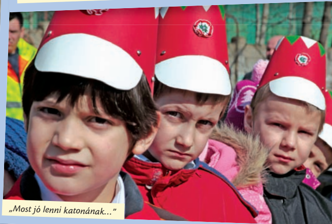
„Most jó lenni katonának...”