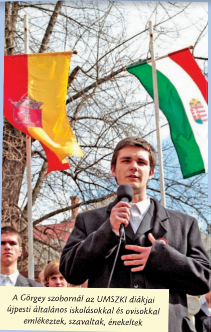
A Görgey szobornál az UMSZKI diákjai újpesti általános iskolásokkal és ovisokkal emlékeztek, szavaltak, énekeltek