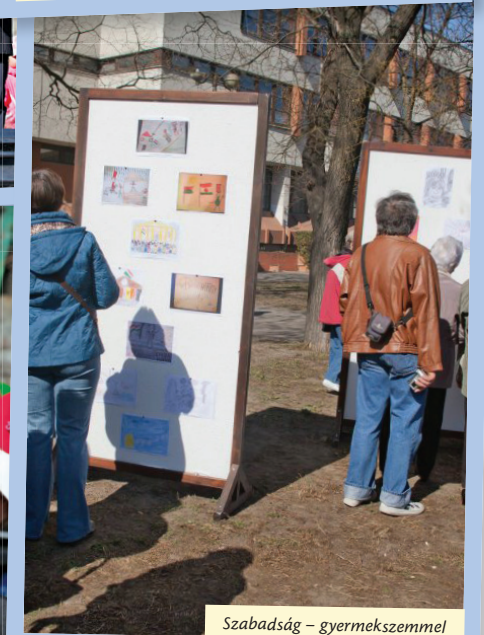
Szabadság – gyermekszemmel