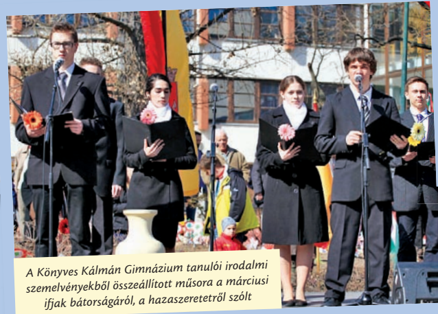
A Könyves Kálmán Gimnázium tanulói irodalmi szemelvényekből összeállított műsora a márciusi ifjak bátorságáról, a hazaszeretetről szólt