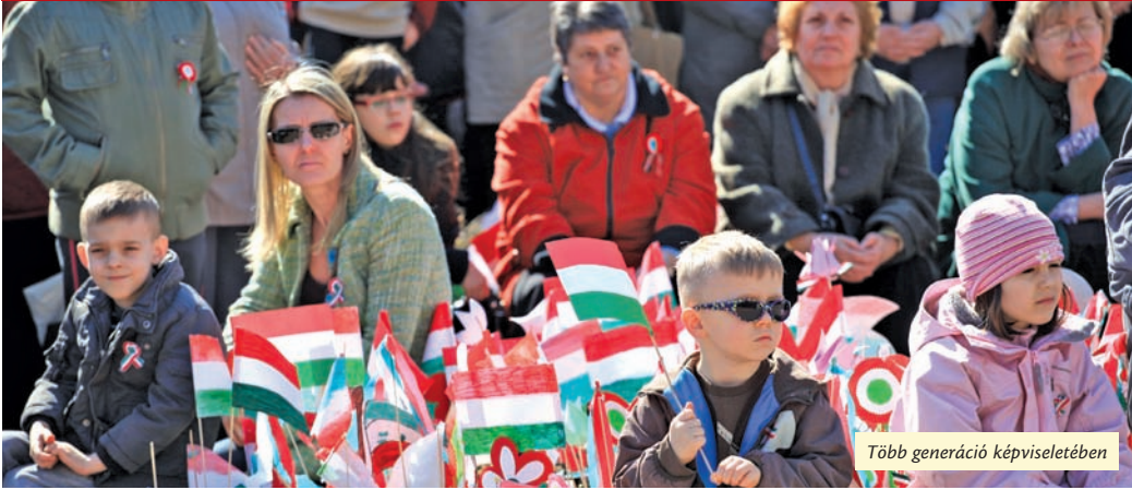
Több generáció képviselésében