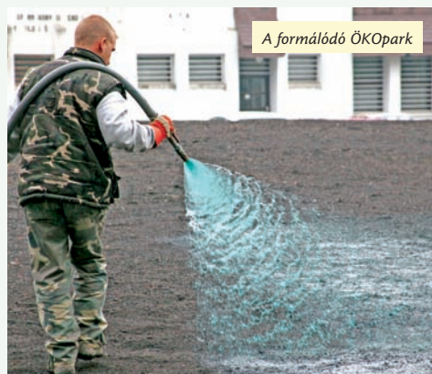
A formálódó ÖKOpark

A program sok más kiemelkedő fontosságú feladat mellett hangsúlyozottan kezeli a kerületben élők, az itt működő termelő ágazatok képviselői és a Polgármesteri Hivatal össze-