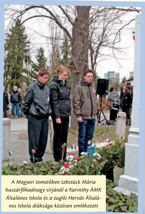
A Megyeri temetőben Lebstück Mária huszárfőhadnagy sírjánál a Karinthy ÁMK Általános Iskola és a zuglói Horvát Általános Iskola diáksága közösen emlékezett