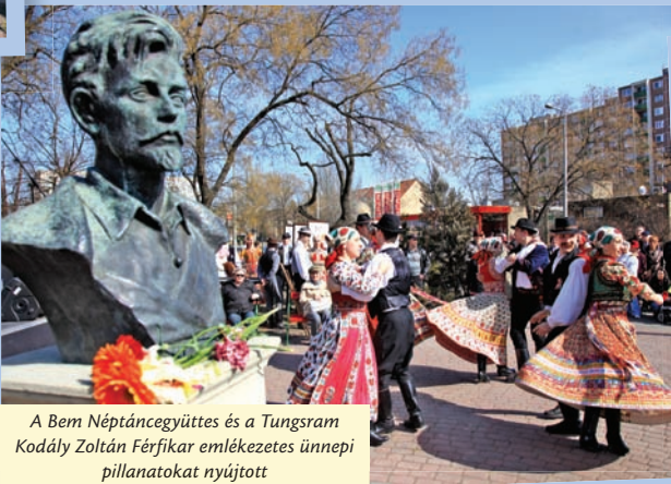
A Bem Néptáncgyűttes és a Tungsram Kodály Zoltán Férfikar emlékeztet ünnepi pillanatokot nyújtott