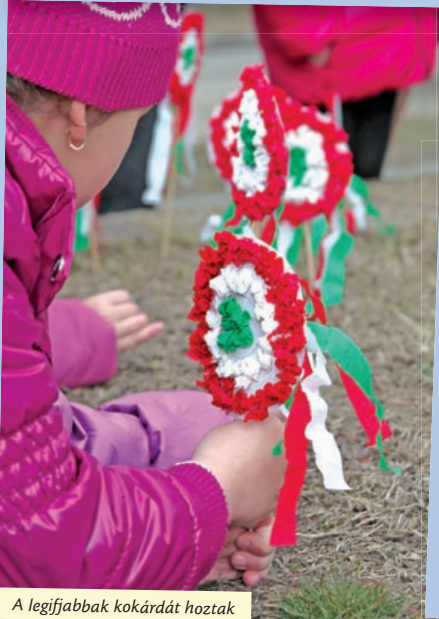
A legifjabbak kokárdát hoztak