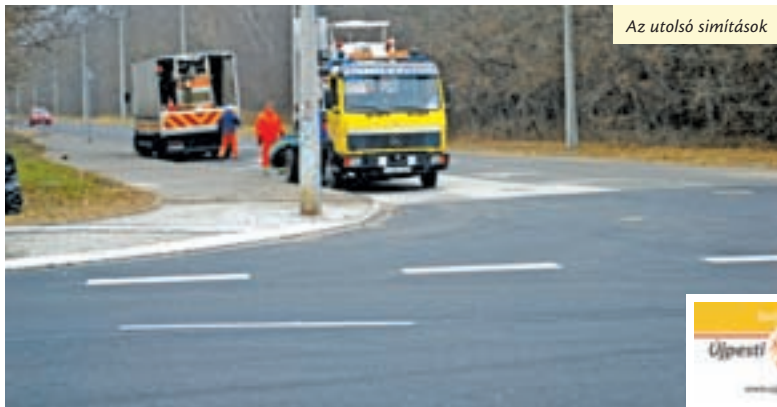
Az utolsó simítások