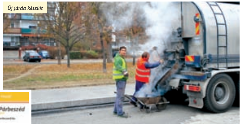
Új járda készült