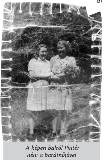
A képen balról Pintér néni a barátnőjével

A vasút útját kőfejtéssel alakítottuk. Tüzet gyújtani fa hiányában nem tudtunk, fáztunk és a tavasz beköszönésével az Angarán keresztül a közlekedés is megszűnt, így élelmünk sem volt. Az örök végső elkeseredésükben egy medvét lőttek s pár napig ennek húsát fogyasztottuk. Már majdnem teljesen feladtam a reményt, hogy valaha is hazakerülhetek.