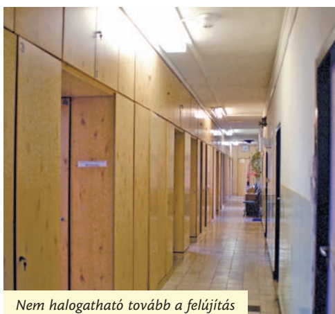
Nem halogatható tovább a felújítás