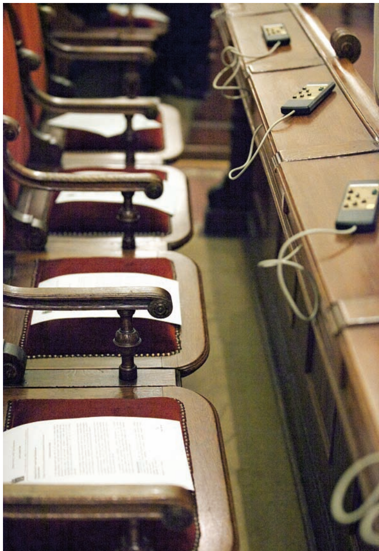
Az MSZP képviselői nem tartották fontosnak részt venni a testület munkájában