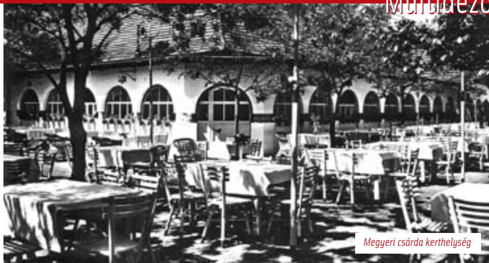
Megyeri csárda kerthelység