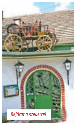
Bejárat a szekérrel