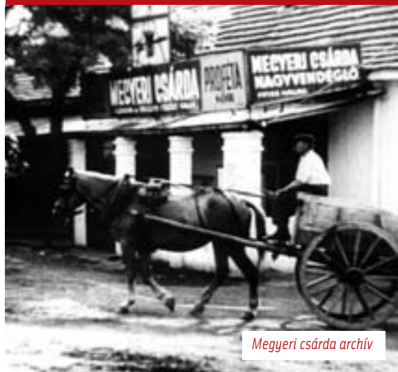
Megyeri csárda archív