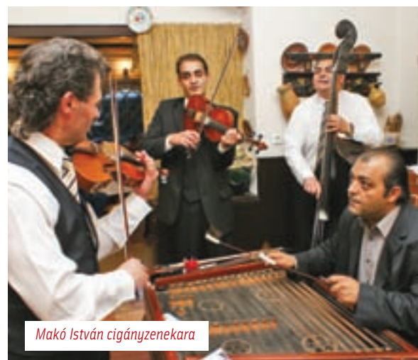
Makó István cigányzenekara