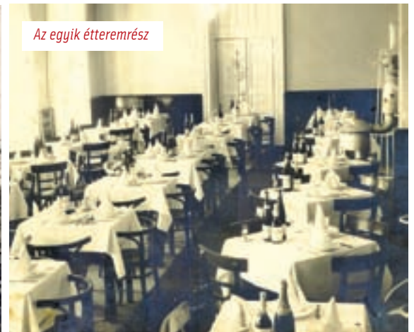
Az egyik étteremrész