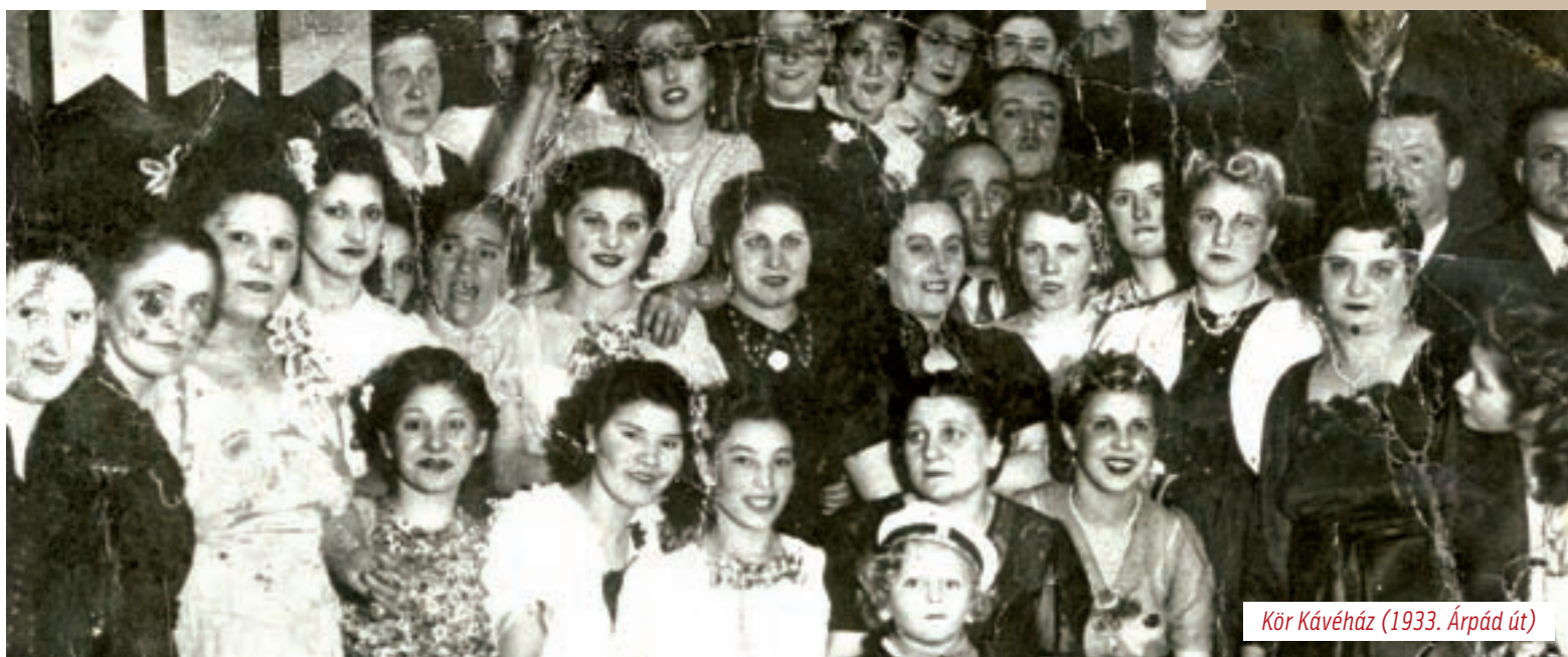
Kör Kávéház (1933. Árpád út)