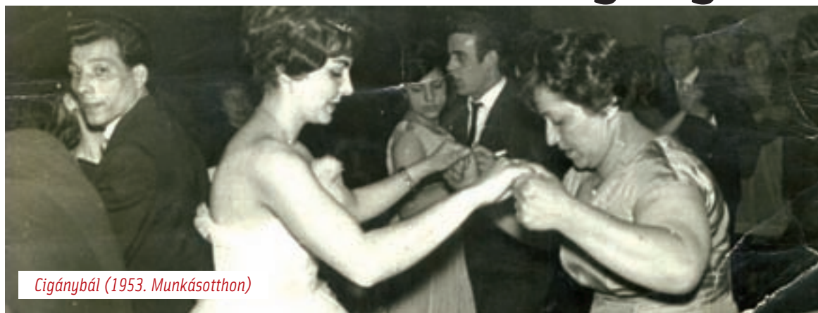
Cigánybál (1953. Munkásotthon)

vagy a csarnokában, ahol gyárra érett nagylányok cicáztak a csávókkal. Fölvetted a jampi szoknyát, Most már nem kellesz. Dehogynem! Csakhogy a cigánybál tisztességes leánykák vására volt, ne feledjük. Az anyák bevonultak velük és helyet foglaltak a Bari Annus rendezése szerinti asztalnál, és mint afféle szomszéd várak, ellenségesen méregették egymást. Virágszálnak öltöztetett leánykák mintha a tündérek barlangjából óvakodtak volna elő idejüket múltan, talán anyjuk elsőbálozó ruhájában. Vigyáztak is rájuk az anyák, mintha soha nem akartak volna megválni tőlük.