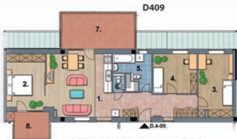
3 hálószobás lakás, ára 36.8 millió Ft