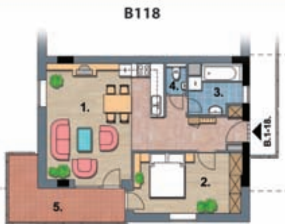
2 szobás lakás, ára 21 millió Ft