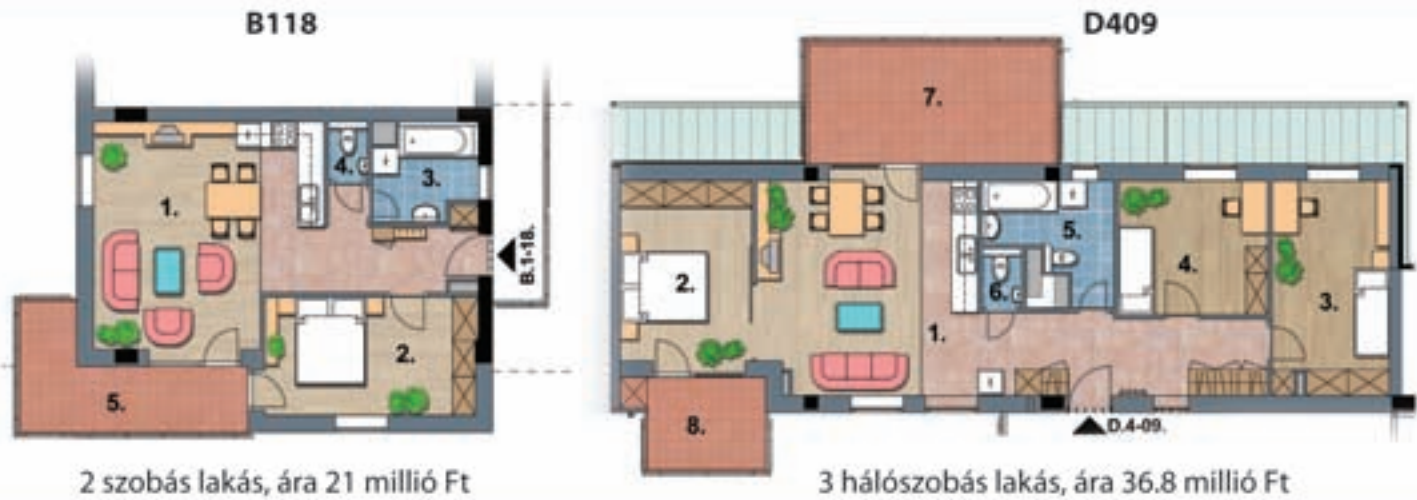
2 szobás lakás, ára 21 millió Ft