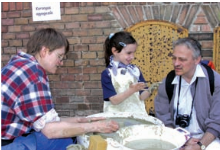
... és a kézműves foglalkozás