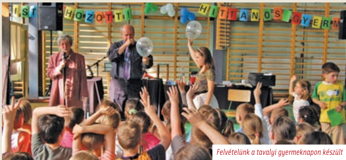
Felvételünk a tavalji gyermeknapon készült

Hittanos kerületi gyermeknapot szerveznek Újpest protestáns gyülekezetei május 18-án, vasárnap, az öröm jegyében. A szervezők szeretettel várnak minden hittanos gyermeket először 10 órára a Belsővárosi Református templomba, ahonnan közösen indulnak át a Benkő István Református Általános Iskolába. A résztvevőkre egész napos program és megannyi kaland vár: lesz ugrálóvár, arcfestés, íjászat, lufihajtogatás, gólyalábazás, tánc, megannyi vetélkedő, és még sok-sok meglepetés.