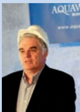
Újpest polgármestere az Aquaworld bokrétaünnepén

közúti hídon hagyjuk el városrészünket. Bár az M0-ás gyűrű északi hídja néhány száz méterrel a főváros határán kívül esik, nekünk már csak újpesti híd lesz a Megyeri híd... Sokan a hídon áthaladva ismerik meg majd a településünket. Bár messze még az az idő, hogy az M0-s környékről szó szerint gyűrűként záródjon, közeledünk ehhez az állapothoz is. Véletlen egybeesés, hogy ugyanezen időben, a híd újpesti lehatárával „szemben” épül az Aquaworld, az a vízi paradicsom, ami szintén a „legek” beruházása, és az Európa Center lakóparkja, logisztikai központja. Közép-Európa legnagyobb vízi paradicsoma, és az 5 csillagos Ramada szálló minden bizonnyal vonzza majd a külföldi és belföldi turistákat, bízom abban is, nagyon sok újpesti család tud majd jegyet váltani a fedett csúszdaparkba. A híd és a vízi park felértékeli a közelben lévő ingatlanok értékét, ismertté teszi településünket mások számára is.