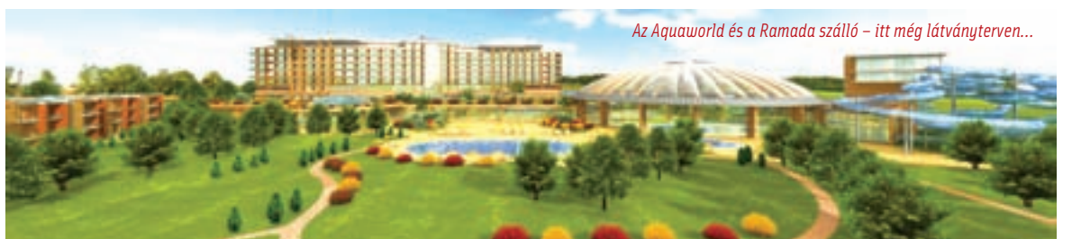
Az Aquaworld és a Ramada szálló – itt még látványterven...

Az integrált városfejlesztési stratégia egyik fő feladata a koncepcióban meghatározott akcióterületek vizsgálata és a fejlesztések meghatározása. Bár az IVS bizonyos mélységig valamennyi akcióterülettel foglalkozik, ám – illeszkedve az uniós tervezési periódusok időintervallumához – külön is kiemeli azt a négy akcióterületet, melyek esetében már a következő tervezési időszakban (2007–2013 között) konkrét eredmények várhatók. Az IVS keretében azt kell megvizsgálni, hogy milyen önkormányzati intézkedésekkel lehet elősegíteni a konkrét célok szakszerű, komplex és időbeni megvalósítását. Minden esetben meg kell tehát vizsgálni, hogy a fejlesztésekben az Önkormányzat (a tervezési feladatok ellátásán túl) milyen – anyagi erőforrásokat is mozgósító – közvetlen, illetve szervezési jellegű beavatkozással tud részt venni.