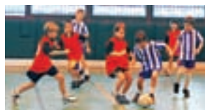
Február 20-án a Szigeti József Utcai Általános Iskola csapata a Szűcs Sándor Általános Iskola csapatával 1-1-es döntőtlent játszott

Több mint nyolcvan versenynap, tizenöt újpesti általános iskola közel 500 csapata, négyezer résztvevő lesz a végéhez közeledő kerületi diákolimpiai sportversenyek mérlege. A jó idő beköszöntével a program szerint befejeződnek az ősszel megkezdett fedett pályás versenyek, így a labdarúgás, a kézi- és kosárlabda és torna küzdelmek, majd március végén a CSIVIT, – a 6–12 éves korúak játékos tornavetélkedői –, míg áprilisban a mezei futás és a váltófutás hívja rajthoz a diákokat. A korcsoportonként meghirdetett diákolimpiai versenyeket öttagú versenybizottság bonyolítja le a Polgármesteri Hivatal Művelődési és Sportosztályával karöltve. Az Újpest Önkormányzata által meghirdetett és támogatott kerületi diákolimpia első hat helyezett intézménye (az erkölcsi siker mellett) sportszervizárlási lehetőségnek örülhet, a diákok pedig oklevéllel és – a dobogós helyezést elérik – éremmel fejezhetik be az idei tanév zárásával egy időben a diákolimpiát.