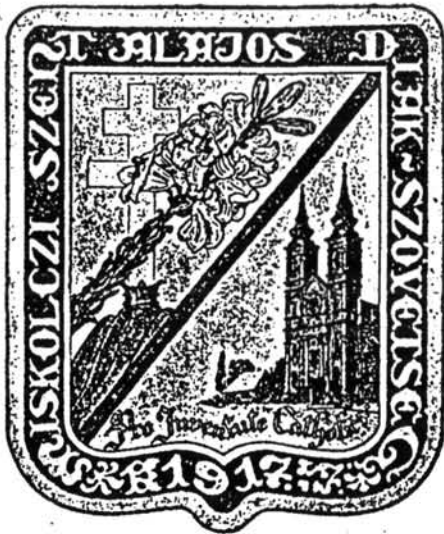
A szövetség jelvénye

Amennyire egyedi volt a szövetség léte és szervezete, annyira egyedi volt a pártfogásba vett diákok kiválasztásának módszere is. Tóth Zoltán Viktor hitt abban, hogy a vidéken kallódó tehetségek egy részét meg lehet menteni, s ennek egyik előfeltétele a felelősségteljes kiválasztás. Mivel a rájuk bízott gyermekeket és képességeiket legjobban a falusi lelkészek és tanítók ismerik, őket kérte fel, hogy válasszanak ki és küldjenek be Miskolcra olyan szegény, de tehetséges fiatalokat, akiket szüleik nem tudnának taníttatni. Ez a módszer rendkívül munkaigényes, de – amint az eredmények igazolják –, biztonságos volt.