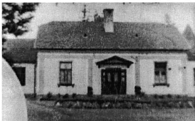
A Szekrényessy-udvarház az udvar felől, az 1910-es években (Bp., a szerző tulajdona)

Nyár utóján végül, a hosszú szabadság miatt, állapotát ellenőrizendő felülvizsgálatot rendeltek el. „ A felülvizsgálat eredménye folytán egy évre várakozási illetéssel szabadságoltattott ”. 27 Ennek következményeként, az immár harmadik éve tartó „ ...dandártiszti iskolát félbeszakította... ” 28