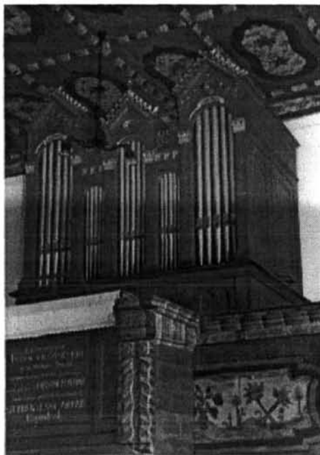
Szekrényessy Árpád által készített borsodi református templom orgonája a Lossonczy- és Szekrényessy-címerrel (fotó a szerző: 1996.)

A vezetése alatt működő presbitérium szigorúan örködött a református község erkölcsi rendjén, különösen is nagy problémát jelentett ez idő tájt (1906!), hogy „a vadhá-zasság igen kezd terjedni” 122 A presbitérium eltökélte, a bűnösök megbüntetésével vet gátat a folyamat terjedésének: „...a felek meg lesznek idézve s ha az illetők a képviselő-testületi közgyűlés határozatának bizonyos idő alatt eleget nem tennének a községből le-endő kitiltásokat fogja kérni.” 123