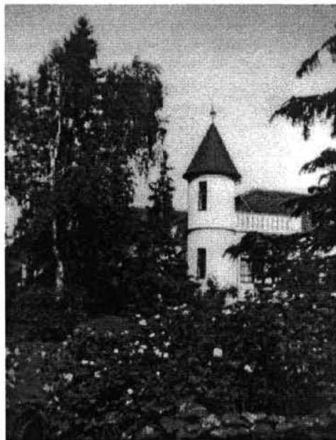
A Szekrényessy-udvarház a park felől 1910-es évekbeli állapot

Árpád mindezekben követte övéit. Az elhanyagolt, sár- és trágyaszagú falusi uradalomból a „kastély” körül virágzó paradicsomot varázsolta. 1875-től több tucat ősfával,