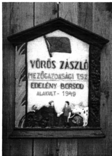
Az udvarházban működő Vörös Csillag, utóbb Vörös Zászló Tsz táblája

Kedvezőbbben alakult a sorsa azoknak a falubelieknek, kik az istenhegyi Szekrényessy-pince oltalmába húzódtak. Őket a megszálló orosz csapatok nem gyötörték meg. 202 December 20-a táján a férfiakat a Szekrényessy-kastély parkjába terelték, s kivágtak velük mintegy ötven sudár ősfenyőt, melyből, s a kocsislakás megbontott gerendáiból új hidat építettek a Bódván. 203