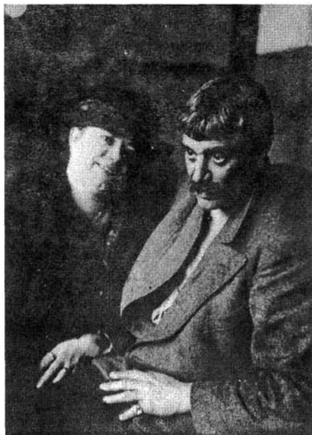
3. kép. Hollósy feleségével