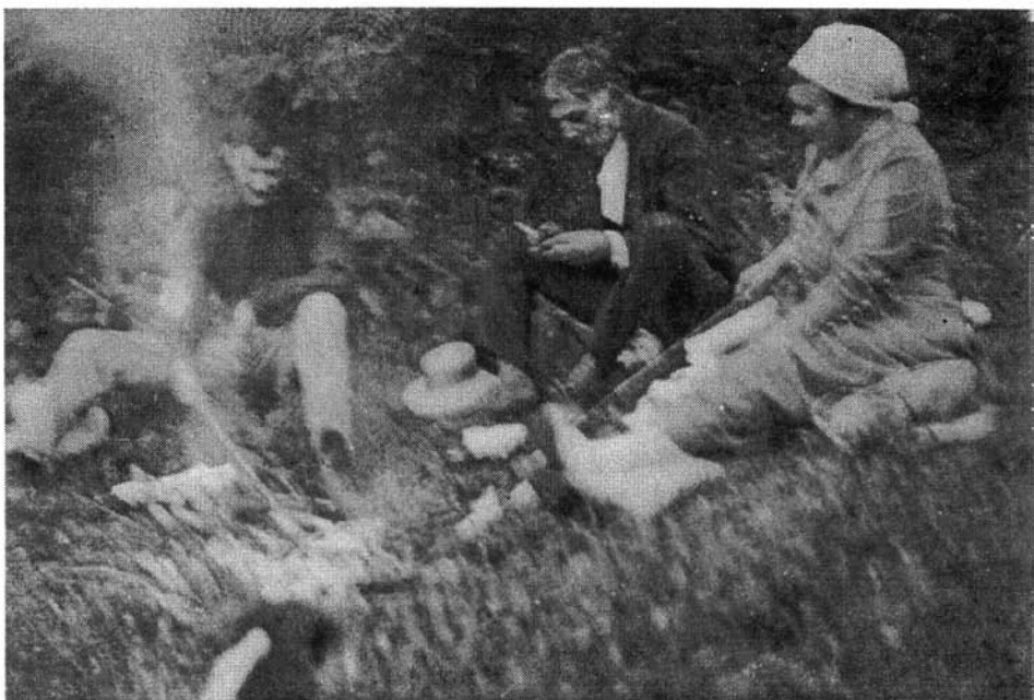
4. kép. Szalonnasütés Técsőn. Hollósy, Hrabéczy