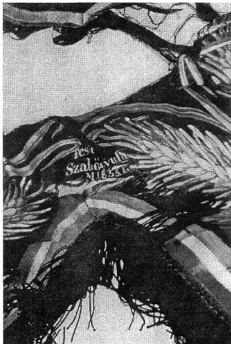
2. kép. Restaurálás kezdete: a zászló alakot ölt