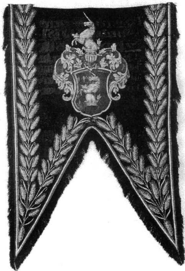
4. kép. A zászló restaurálás után

ugyanis fehér, valamint a ragasztóanyag is. Ott, ahol a zászló folyamatossági hiányai vannak, a címer felőli oldalon a ragasztós fehér kreplin áttűnik. Az elővillanó kisebb-nagyobb fehér csíkok nem keltenek jó esztétikai benyomást. Ha a zászló alapanyaga nem fekete volna, talán nem lenne ilyen erős az eltérés. Feltehetően megoldás lett volna kreplin feketére, vagy szürkére festése, de ez ebben az esetben már feltételezés marad. Következő zászló esetében szükséges próbákat végezni ezt az eljárást illetően. A felmerült probléma megoldására újabb hosszadalmas feladat következett, mely terveim között nem szerepelt mindaddig, míg a zászlót meg nem fordítottam. A dublázó anyag előkészítéséhez használt kétkomponenses ragasztó felhasználásával, melyet fekete olajfestékkel feketére színeztem, az eltűnő fehér kreplint nagyon vékony ecsettel mindenhol átfestettem. Nagyobb folytonossági hiányoknál és a kicsi csíkoknál is azonos módon jártam el, mindig csak a kreplint festve. Későbbi restaurálás során a kreplin eltávolításával ez a felvitt fekete massa is eltávolítható, tehát a címer felőli beavatkozás eltüntethető. Most egységes fekete színű a zászló alapanyaga, esztétikailag kielégítő. A címer ép, összeillesztve, alátámasztva – muzeológussal egyetértésben – restaurálást nem igényel.