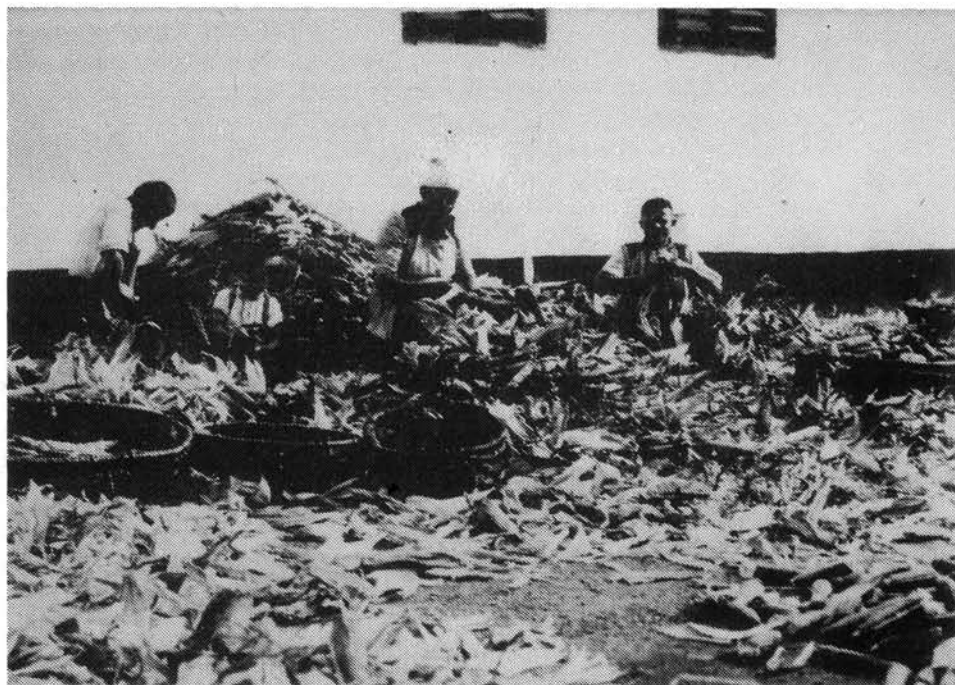
6. kép. Kukoricafosztás. 1929. HOM ltsz.: 1961.