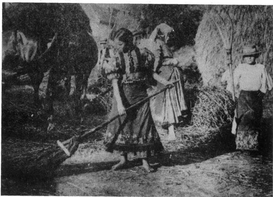
4. kép. Nyomtatás lóval. HOM NA. ltsz.: 3753/15.