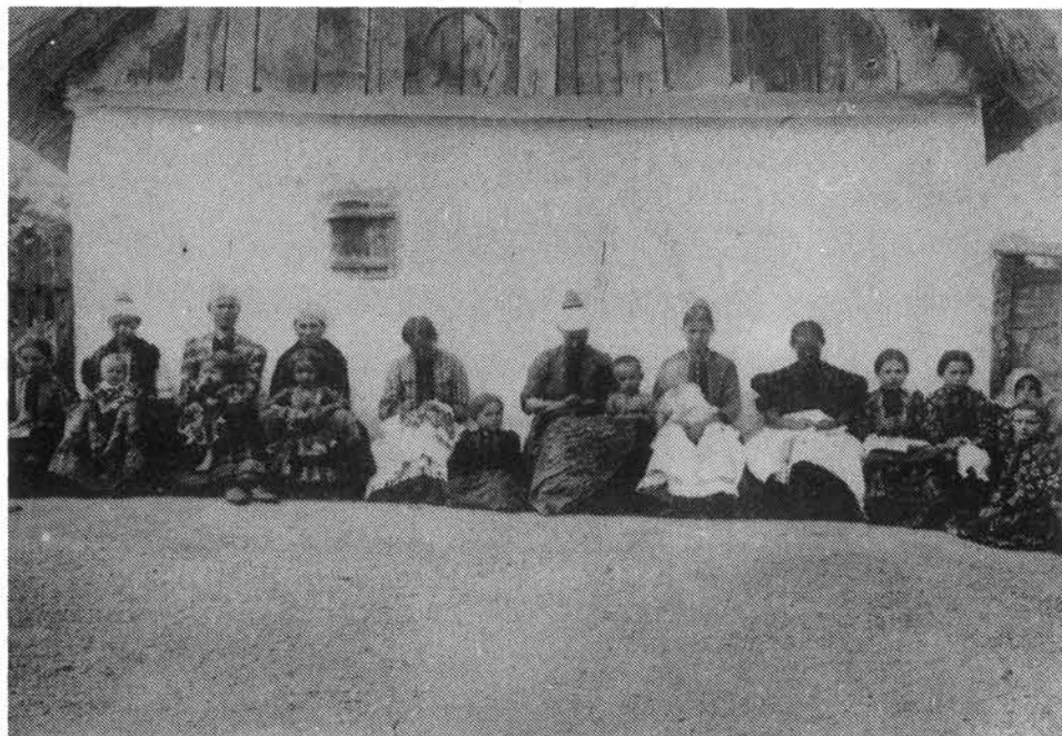
5. kép. Varrótanya a század elején. HOM ltsz.: 6571.