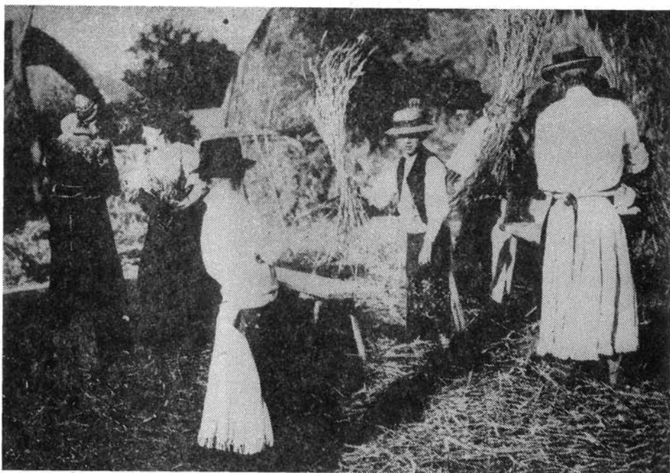
3. kép. Cséplés. HOM NA. ltsz.: 3753/7.