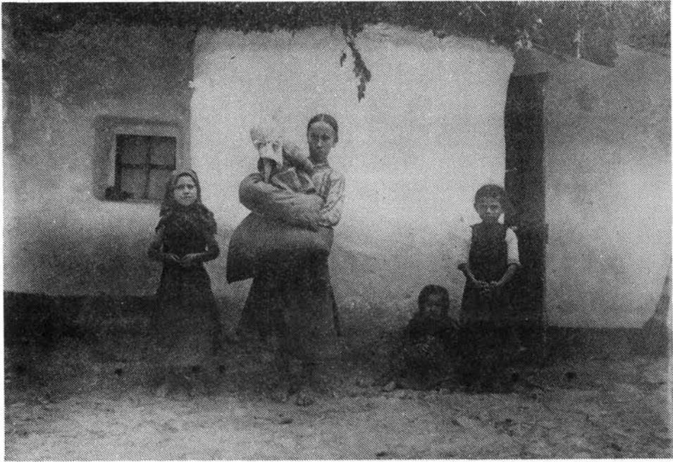
1. kép. Nagyobb lányka kistestvérét dajkálja. HOM ltsz.: 1754.