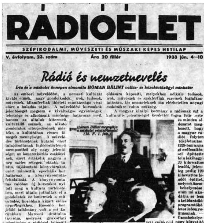
13. kép. A miskolci rádió közvetítőállomásának avatása

A Gazdakör Miskolc kulturális életének fontos tényezője volt, nemcsak a maga keretén belül teremtett magas színvonalat, hanem azzal, hogy tagjai a Köörön kívül is lelkes pártfogói voltak a kulturális életnek. 116