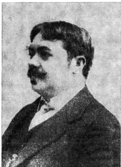
1. kép. Szent-Gály Gyula a miskolci városi zeneiskola igazgatója 1909—1919.