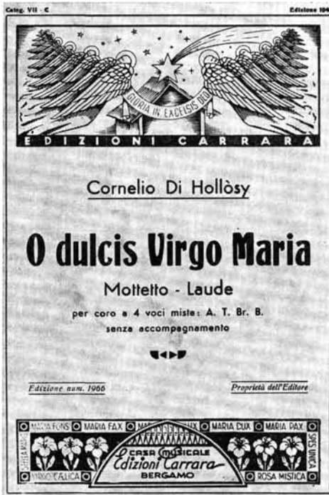
7. kép. Hollösy mű olasz kiadású címlapja