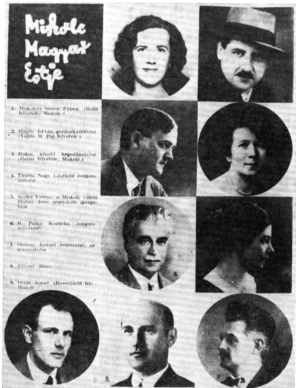
12. kép. A Magyar Rádió miskolci zenei estjének szereplői (1933)