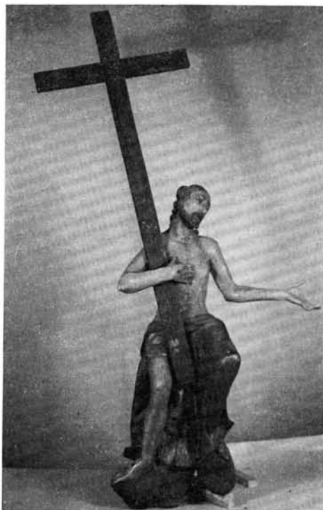
5. kép. Fiúisten szobor. Átvételi állapot