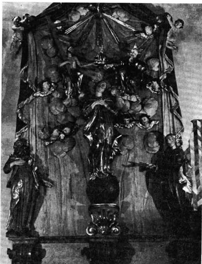
8. kép. Tornaszentandrás. Mária-oltár a restaurálás után

Azokon a részeken, ahol az alapozás hiányzott, a hiányokat bolognai krétával pótoltuk és szintbecsiszoltuk.