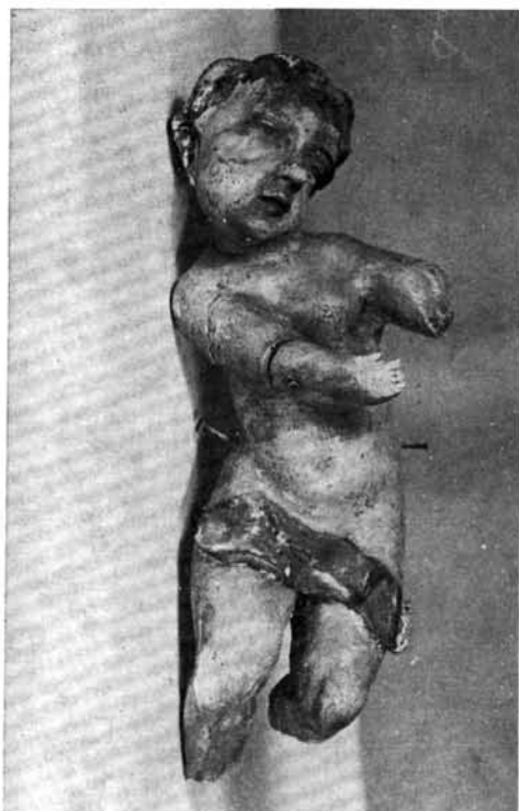
2. kép. A baloldali puttó. Átvételi állapot. Előnézet