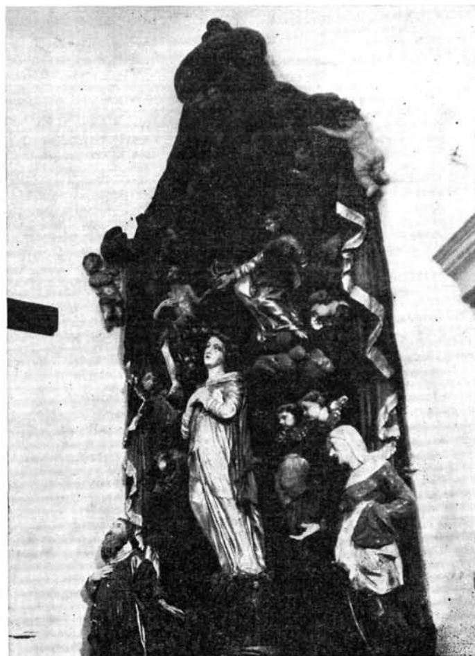
1. kép. A tornaszentandrási Mária-oltár, restaurálás előtt

Oltáréptmény: predella — a felület erősen át volt festve olajfestékkel. A konzolok barnára, a betétrészekben zöld márványozás. Az eredeti színezés: