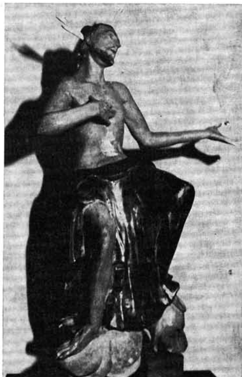
6. kép. Fiúisten szobor tisztítás és krétaalap-kiegészítés után

fémszínezett drapériák : lakk, v. sárga lazúr, alatta arany és ezüst, alatta ugyanez nyomokban.