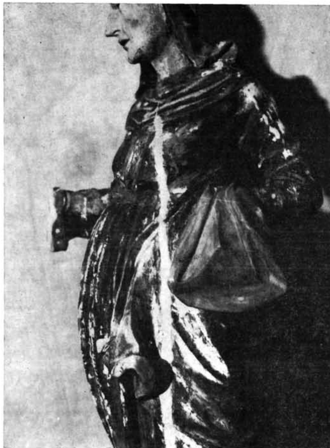
7. kép. Szent Anna-szobor tisztítás és krétaalap-kiegészítés után

A hátfal deszkáit a telítéssel egybekötve kiegyenesítettük, majd száradás után összeragasztottuk. A szerkezet stabilitását kettős andráskereszt merevítéssel oldottuk meg.