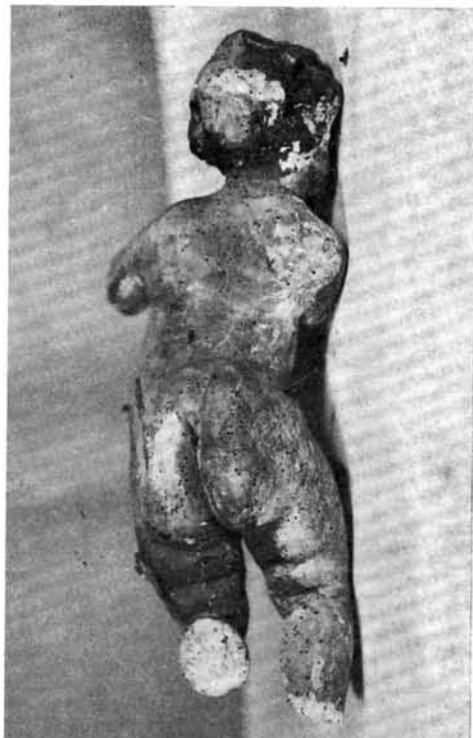
3. kép. A baloldali puttó. Átvételi állapot. Hátulnézet

konzoloknál kobaltkék, a betétrészekben halvány kékesvörös márványozás temperával.