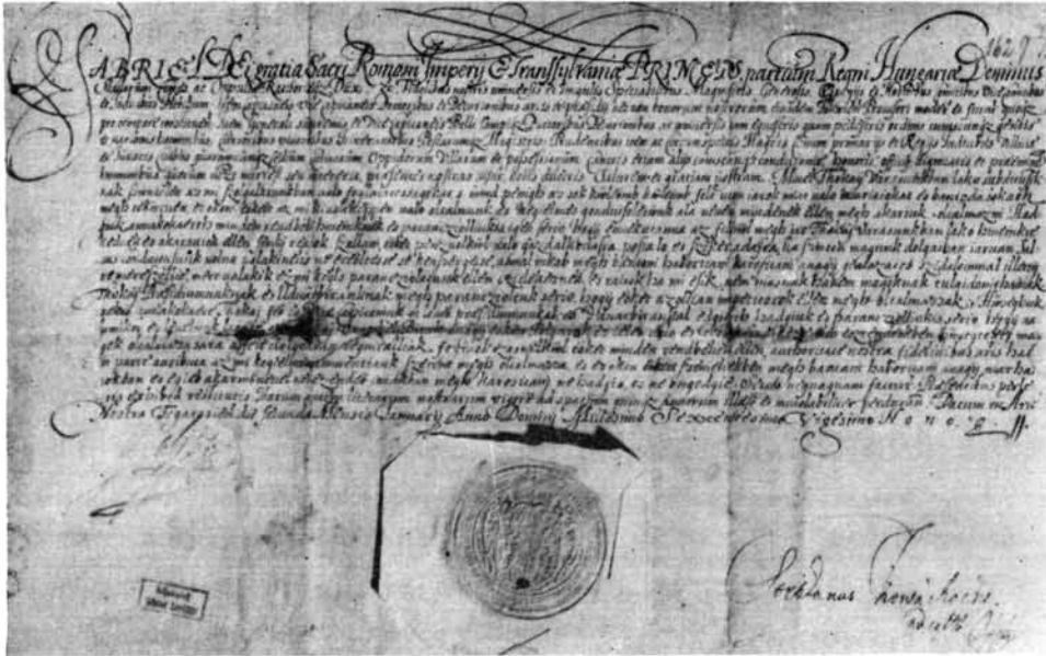
1. kép. Bethlen Gábor kiváltságlevele 1629. január 2.

A XVII. század zavaros politikai viszonyai érdekes helyzetet teremtettek a posta működésében. Tokajt kétféle postahálózat érintette. A fejedelmi postán kívül Tokaj a királyi postahálózatnak is fontos állomása volt.