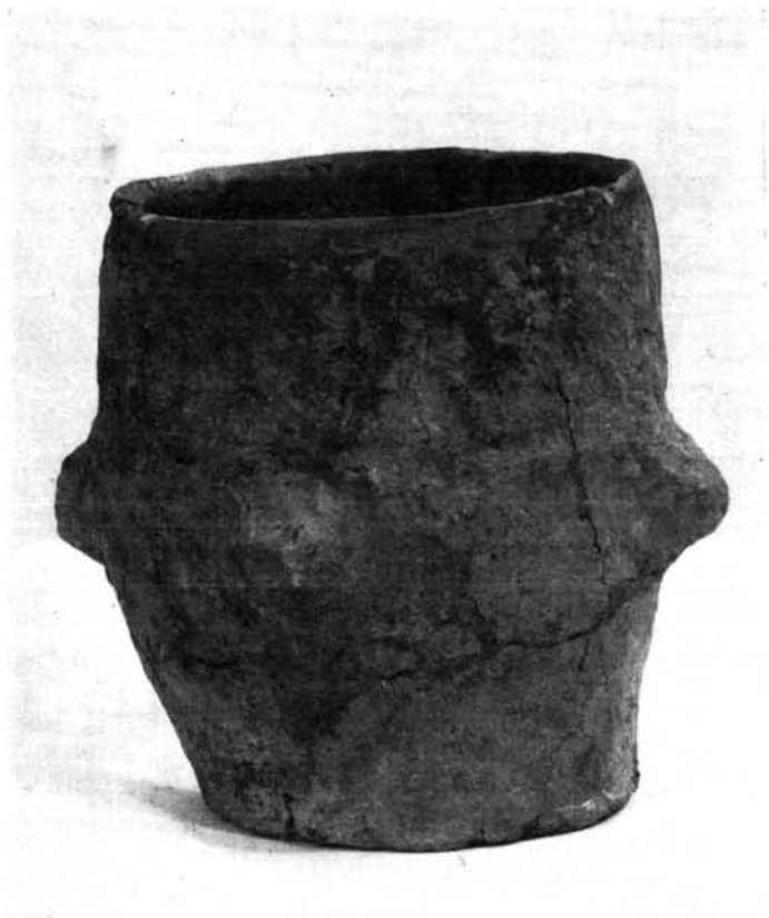
2. kép. Rézkori edény Tiszadorogma