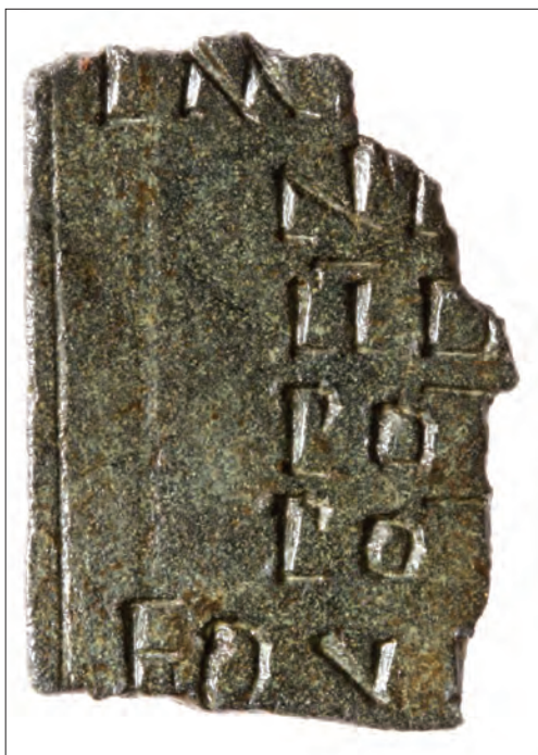
2. kép. A diploma külső oldala