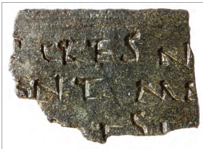
3. kép. A diploma belső oldala