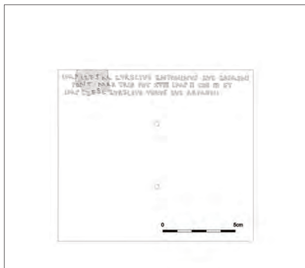
5. kép. A diploma belső oldalának rekonstrukciója (Rajz: Lajtos T.)