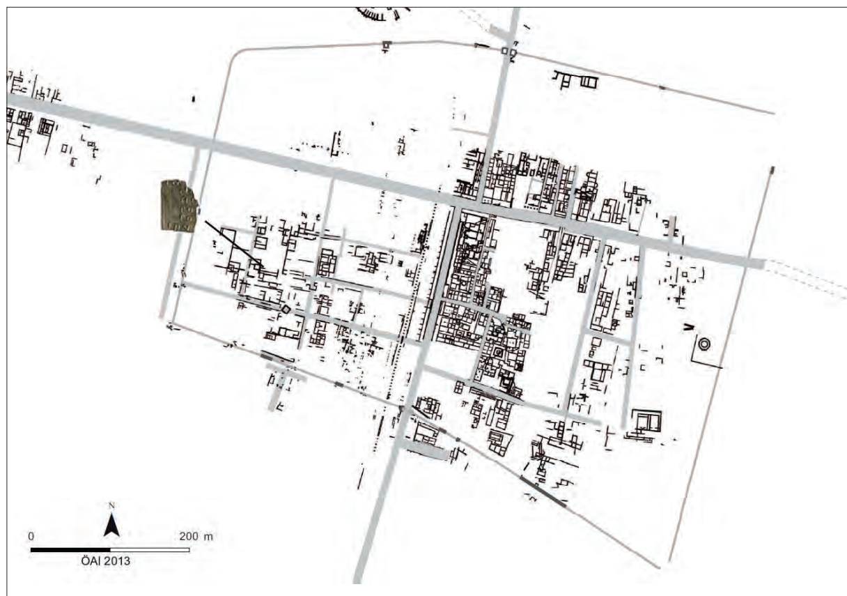
1. kép. A katonai diploma lelőhelye